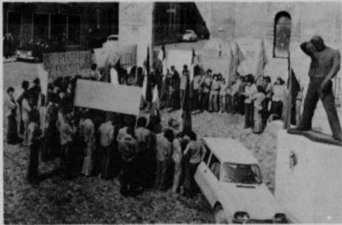
Brigadirji, zbrani na Slovenskem trgu v Ptuj.

Številnim protestnim zborovanjem so se v ponedeljek, 23. avgusta priključili tudi brigadirji četrte izmene MDA Slovenske gorice 76. Brigadirji so s številnimi transparenti in zastavami obšli ptujske ulice, nato pa se ustavili na Slovenskem trgu.