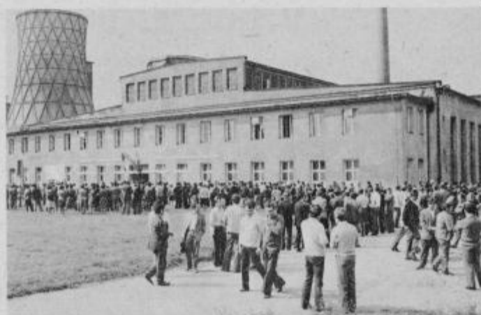
Množično protestno zborovanje delavcev v TGA „Boris Kidrič“ Kidričevo.

V četrtek zvečer se je sestel tudi zbor delegatov krajevne skupnosti Kidričevo, ki mu je predsedoval Franc Klemenčič. Na zboru so prav tako protestirali proti nerazumljivi gonji in brutalnemu početju