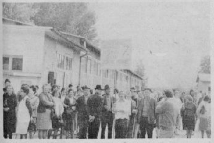
Pred „Tehnoservisom“ v Ptujju se je zbralo nad 500 delavcev Kmetijskega kombinata Ptuj.

Delavci in kmetje, povezani v skupnosti TOZD „Jeruzalem“ Ormož, zbrani na protestnem zborovanju 19. avgusta 1976, najodločneje protestiramo proti politiki Avstrije, ki je naperjena proti Slovincem in Hrvatom, živečim v Zvezni republiki Avstriji.