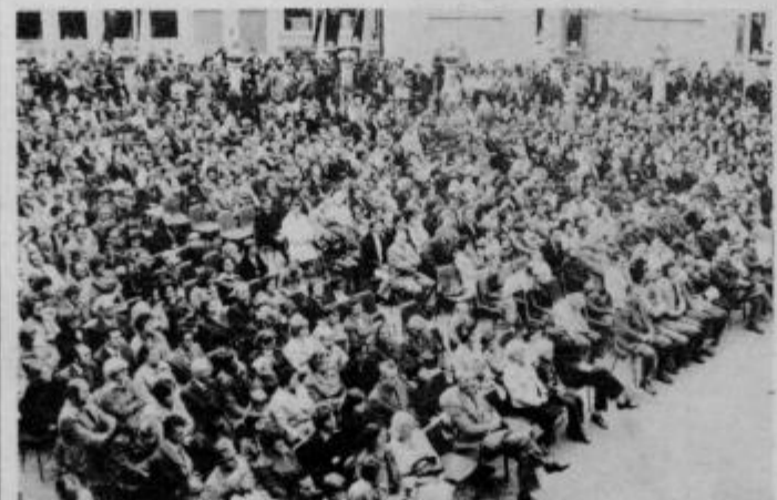
Številno občinstvo je tudi letos vse tri festivalske večere napolnilo letni prireditveni prostor.

Festival je končan, festival je bil obiskan, festival tudi drugo leto, a še bolj vesel, seveda še kvalitetnejši.