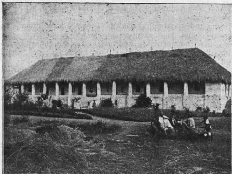
Misijonska postaja Bugoyé (Uganda).