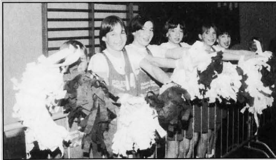
Jadranove navijačice imajo razlog za zadovoljstvo

Konec prejšnjega tedna je potekal v znamenju dveh pomembnih dogodkov za naš šport. V nogometu si je moštvo doberdobske Mladosti z zunanjo zmago proti Medeji 0:1 v 24. kolu 2. amaterske lige matematično zagotovilo napredovanje v 1. amatersko ligo. V košarkarski C ligi pa je Jadran Nuova Kreditna z zmago v gosteh proti Castelfrancu z izidom 69:71 dosegel uvrstitev v play-off.