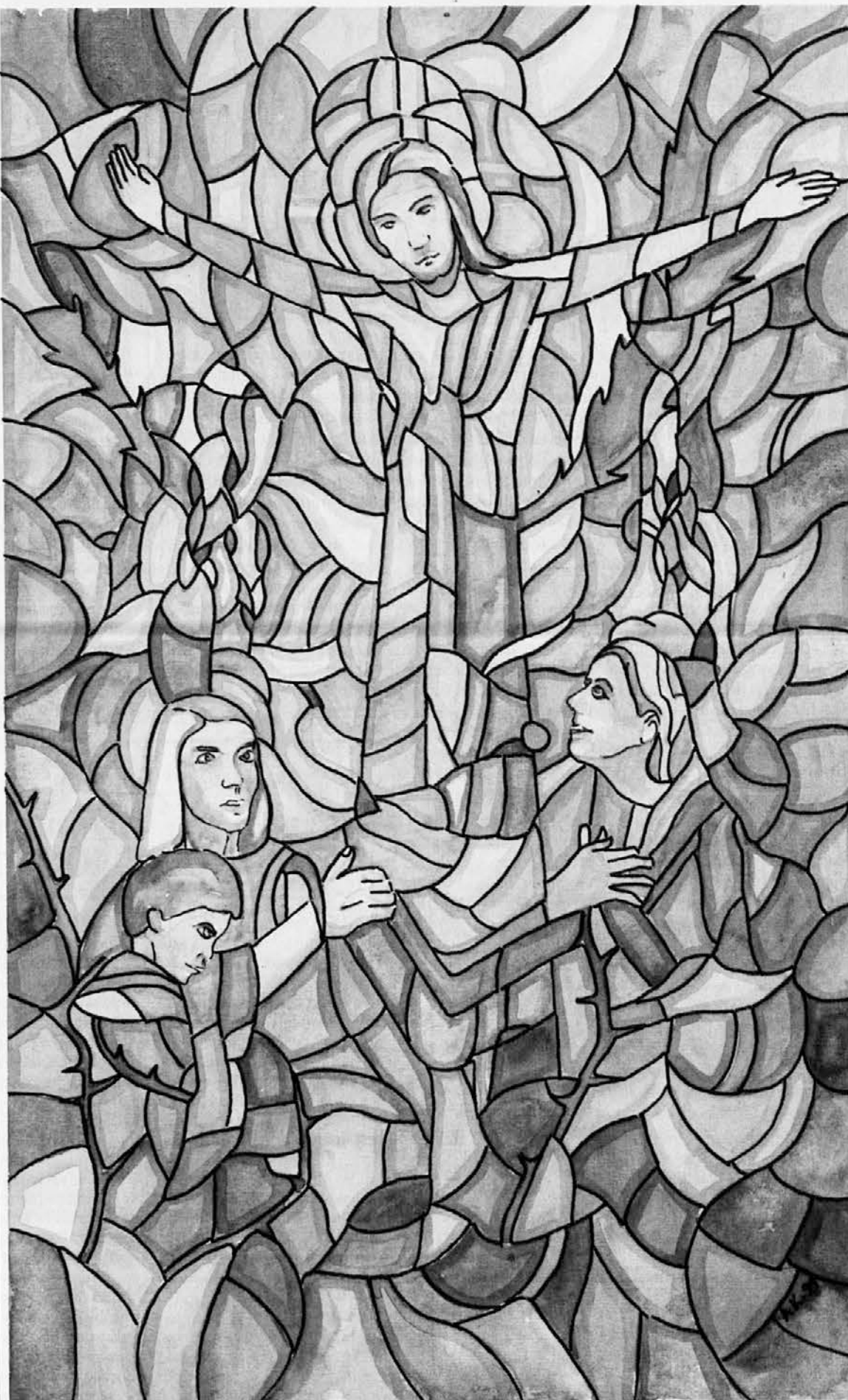
Andrej Kosič, Vstajenje, 1999, osnutek za vitraj