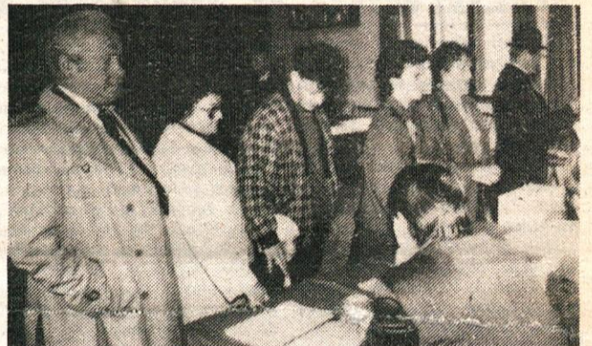
Volišče v kulturnem domu KS Podgorje.