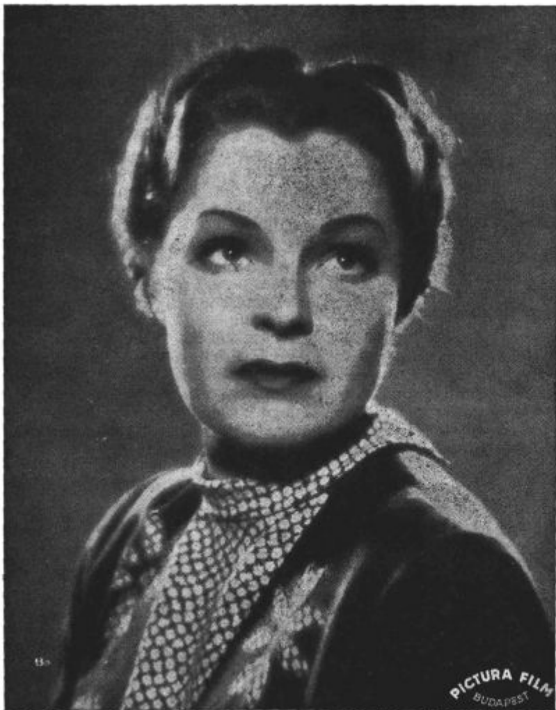
Magda Schneider v filmu »Žena na r azpotju«, kino »Union«.

Vprašanje orkestra je bilo eno izmed najtežjih, a so ga rešili odlično. Nad 90 najboljših švicarskih mojstrov — glasbenikov se je združilo v močan in ubran orkester. Poleg Toscaninija nastopajo še tile znani dirigenti: Adrian Boult, Ernest Anser-