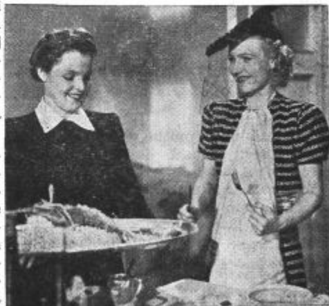
Iz filma »Žena na razpotju«. Film ima na sporedu kino »Union«.

Prihodnje zasedanje bo koncem aprila prihodnjega leta v Rimu.