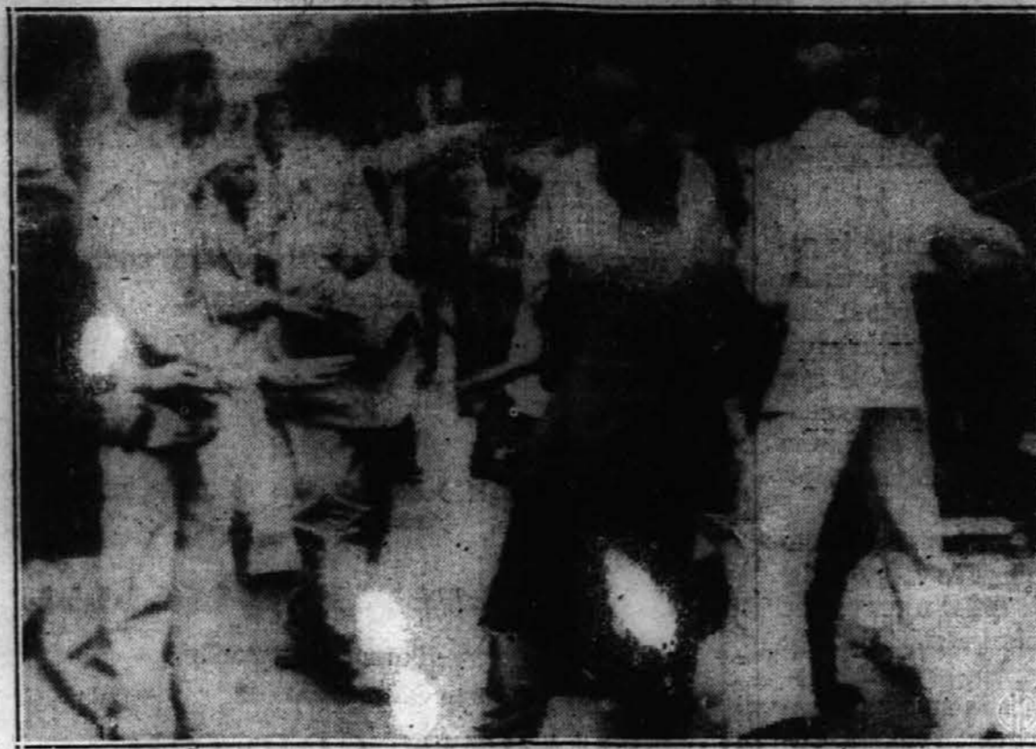
Razjarjeno nad vestmi, da so osični podmorniki potopili več brazilskih trgovskih ladij, je prebivalstvo v brazilski prestolnici Rio de Janeiro nedavno vprisrilo poulične demonstracije, pri čemer je bila vzeta gornja slika. Več nemške lastnine je bilo pri tem razbita.

Na misel mi je prišlo: Lepo bi bilo, če bi Ave Maria Koledar in Baragova pratika imela v koledarskem delu vse važne datume iz Baragovega življenja. Tako n. pr. pri 31. decembru: Prihod Barage v Ameriko (1830), 21. september: Baraga posvečen v duhovnika (1823), in tako dalje. Kaj se vam zdi? Ali ne bilo izvrstno, če bi Slovenci vedno imeli pred očmi tako važne datume glede