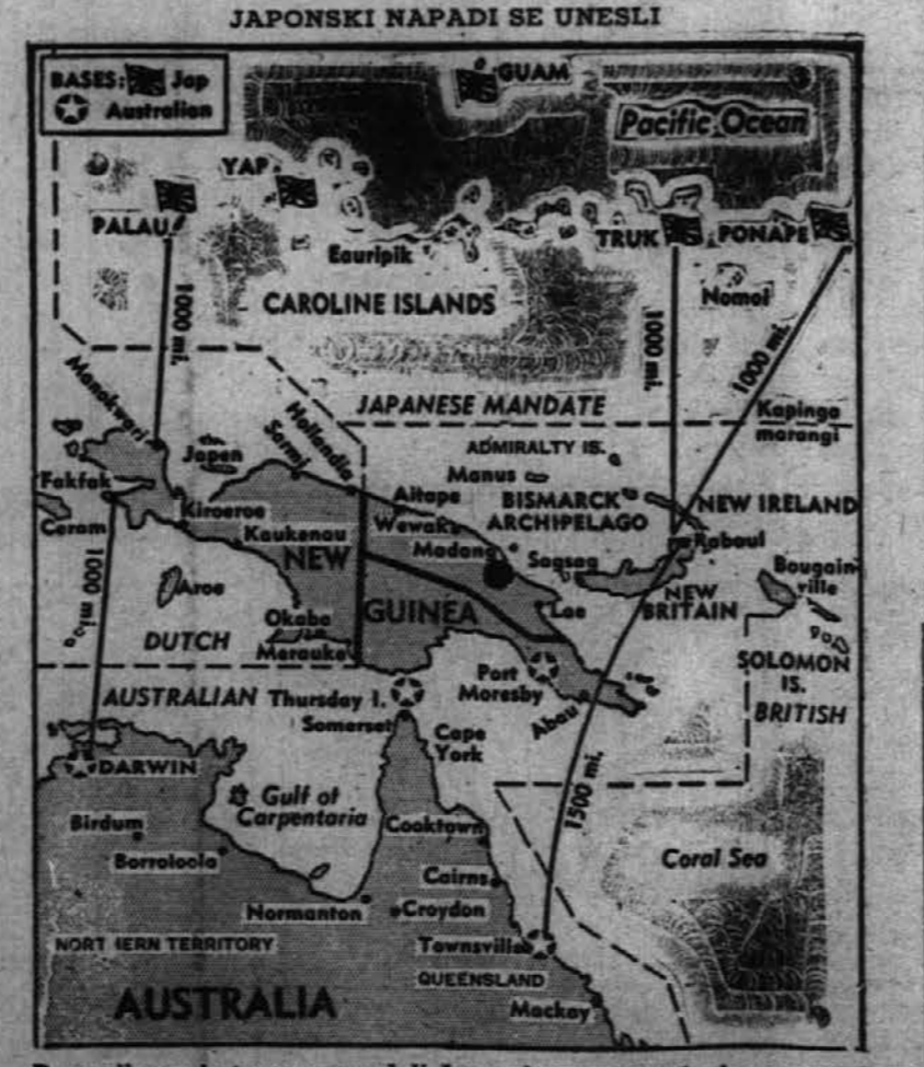
Prva vliha, s katero so napadali Japonci razne postojanke na zapadnem Pacifiku, se je znatno poglobila, kajti zadeli so na močnejši odpor zaveznikov. Tako tudi na otoku Nova Guineja, ki ga kaže gornji zemljevid, niso zadnje čase dosegli nikakega napredka.

Od te nedelje opolnoči je v trgovinah prepovedano prodajati hlače, ki imajo zavahane robove. Koncem zadnjega tedna je bil zato v prodajalnih pravih naval za obleko "po starem".