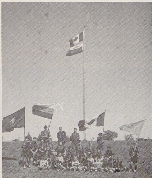
Volčiči in voditelji iz župnije Marija Pomagaj leta 1964 ali 1965 na Slovenskem letovišču

(5) Prim. omenjeni pismi J. Kopača in poročilo B. Potočnika. Našel sem tudi podatek, ki verjetno zadeva uradno ustanovitev: »V župniji Brezmadežne je bila or-