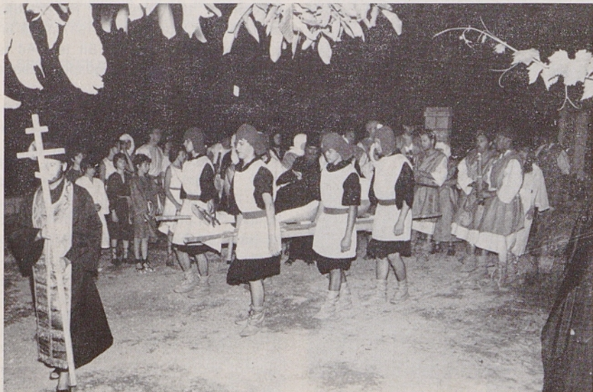
V sugestivnem okolju repentabskega griča so igralci takole odnesli Metodovo truplo v Marijino cerkev, iz katere se je oglašal mrtvaški zvon