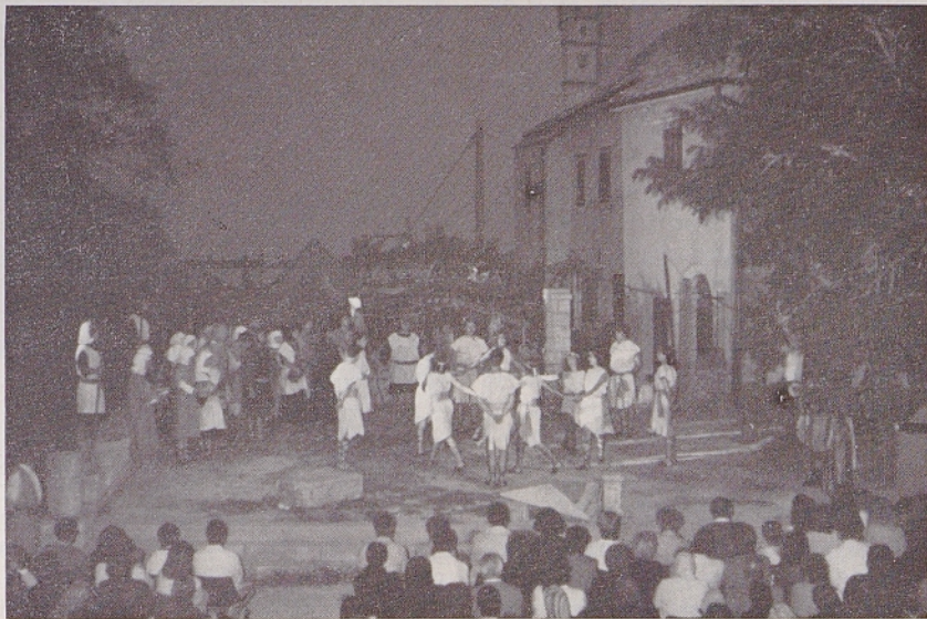
Metodovo slavlje na Repentabru v začetku letošnjega julija. Med predstavo zgodovinske igre »Blagovestnika z vzhoda« so nastopili tudi plesalci

Sredi junija so v Sloveniji odprli nov odsek avtoceste med Ljubljano in Naklom pri Kranju. Odsek so gradili dve leti in pol. Stal je deset milijard dinarjev.