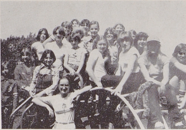
Dekleta na taborjenju