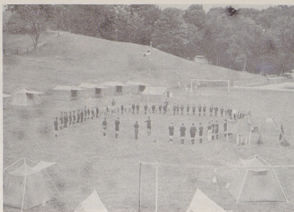
Del skavtov iz obeh župnij na Slovenskem letovišču leta 1964 ali 1965

Kot živi pripadniki slovenske skupnosti so se vedno udeleževali tudi slovenskih prireditev v Torontu in na Slovenskem letovišču. Tako so