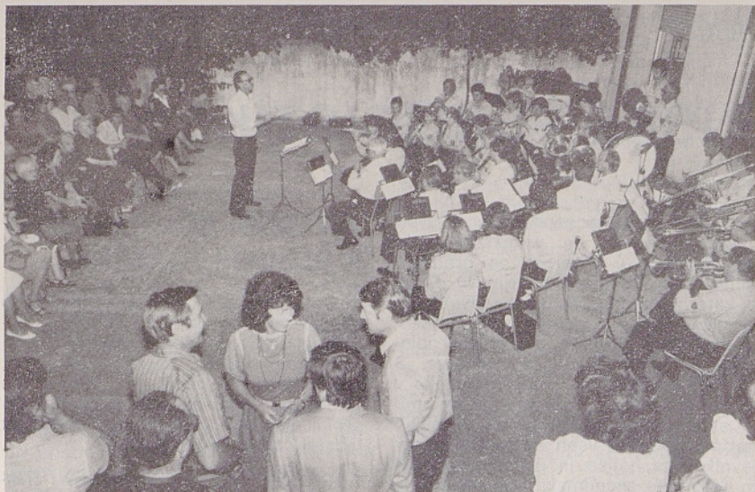
Pihalni orkester »Breg« je imel na dvorišču Mladinskega doma v Dolini celovečerni koncert ob prazniku vaškega zaveznika sv. Urha