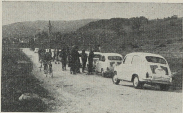
Zbor kolone na poti proti Cerkljevemu jezeru. Na odcepu pred Planino 19. aprila 1964.

Zavedati se moramo, da je nujno potrebno imeti za varno vožnjo — v redu kolo.