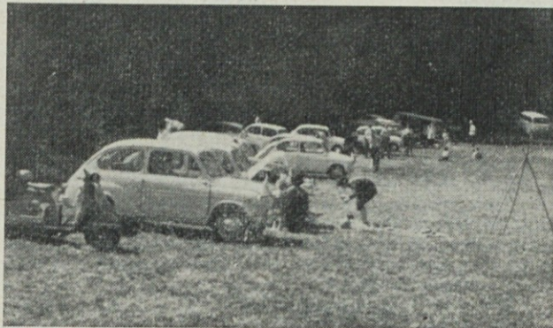
V zavetju hribov se je kolona ustavila in »utaborila«. Skupno je bilo v vrsti 19 avtomobilov, 2 avtorollerja in 2 mopeda

Minil je lep dan za udeležence. Dan, ki je v polni meri služil rekreaciji in uživanju v prosti naravi, daleč proč od vsake gostilne in pitne vode. Prepričan sem, da bo tudi prihodnje »POPOTOVANJE V NARAVO« uspelo. Odveč je samo prijavljanje vseh tistih, ki že pri prijavi vedo, da se organiziranega izleta ne bodo udeležili. Pa kaj bi dolgovezil — vsi, ki bi lahko šli so nam lahko le nevoščljivi za prijeten dan kjer smo na svojvrsten način oživel družabno življenje — tokrat na obali CERKNIŠKEGA JEZERA.