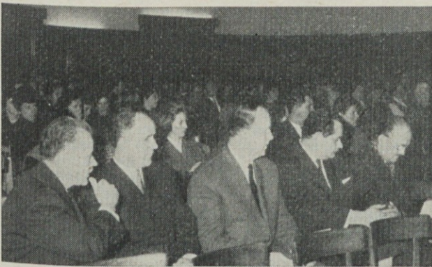
Gostje na V. občnem zboru Društva knjigovodij

Kandidatno listo ki jo predlaga določeno število volivcev, more predlagati najmanj 1/10 vseh volivcev. V podjetjih, ki imajo več kot 500 volivcev, pa more