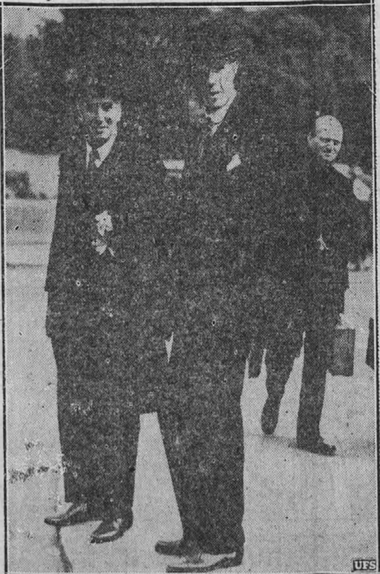
Napeta situacija v Evropi gotovo povzroča marsikateremu diplomatu nič brez spanja. Slika kaže dve taki angleški osebnosti, namreč Sir Johna Simona, "Chancellor of the Exchequer", (na levi), in Lord Halifaxa, zun. ministra, ko sta nedavno šla na sprehod po celodnevni konferenci.