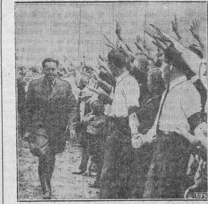
Hitler je "veliki Fuehrer", Henlein, vodja čeških Nemcev, je "mali Fuehrer" in Henleinov zastopnik je Frank; tega kaže slika, ko ga češki Nemci pozdravljajo pri nekem zborovanju.

čega rastlinstva; te meje so kakor valolomi zoper peščene valove.