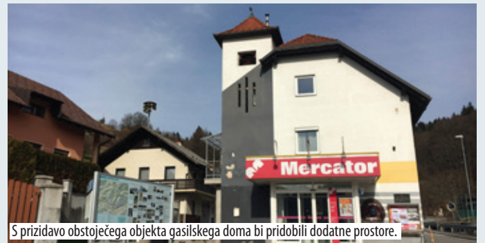
S prizidavo obstoječega objekta gasilskega doma bi pridobili dodatne prostore.