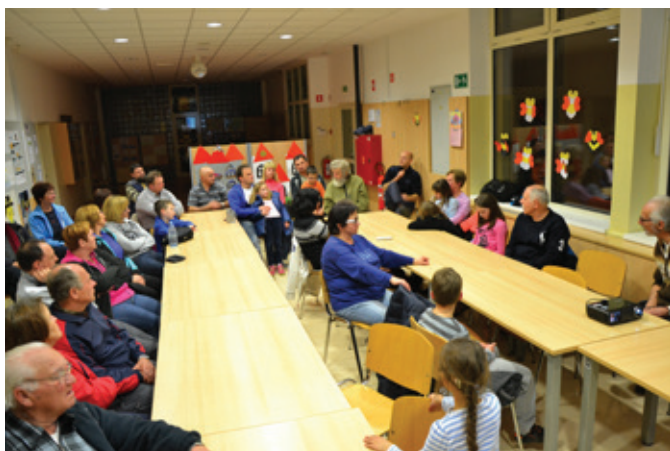
Zbrani udeleženci v OŠ Blagovica