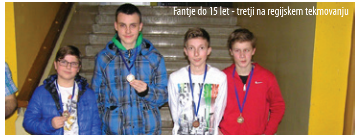
Fantje do 15 let - tretji na regijskem tekmovanju