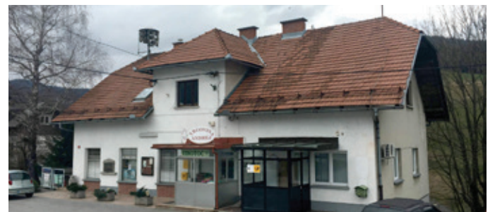
Z obnovo se bodo izboljšali pogoji za delovanje lokalnih društev.