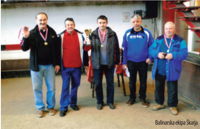
Balinarska ekipa Škarja

Pred nedavnim je bil zaključen zimski balinarski turnir, na katerem je sodelovalo osem ekip iz treh občin.