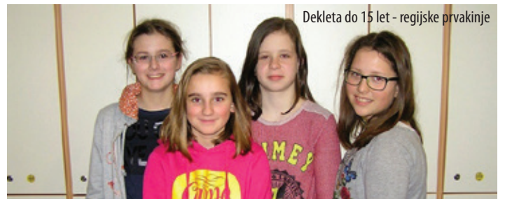
Dekleta do 15 let - regijske prvakinja