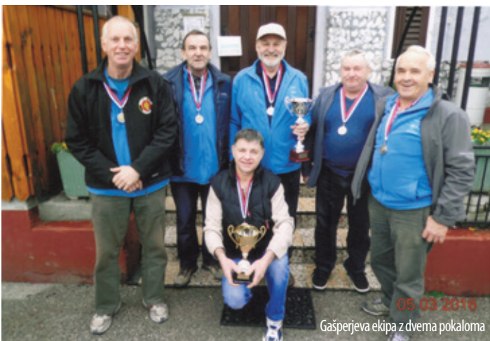
Gašperjeva ekipa z dvema pokalom