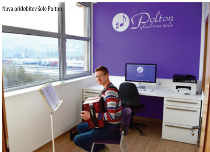
Nova pridobitev šole Polton