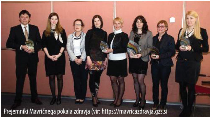
Prejemniki Mavričnega pokala zdravja

Izboljšanje zdravstvene in varnostne ozaveščenosti zaposlenih ter promocija pomena zdravstvene in varnostne ozaveščenosti zaposlenih v storitvenih dejavnostih.