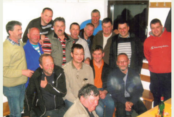
Šahisti Zlatega Polja in Gradišča po končanem srečanju

Del prostega zimskega časa so nekateri člani športnega društva Zlato Polje izkoristili ob šahovnicah na tako imenovanem zimskem šahovskem turnirju.