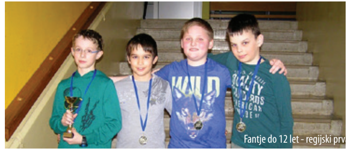
Fantje do 12 let - regijski prv