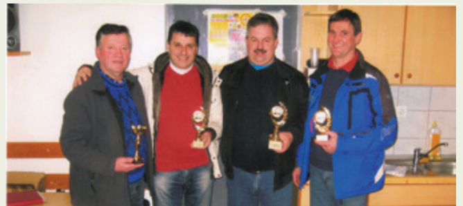
Zbrali so največje število točk