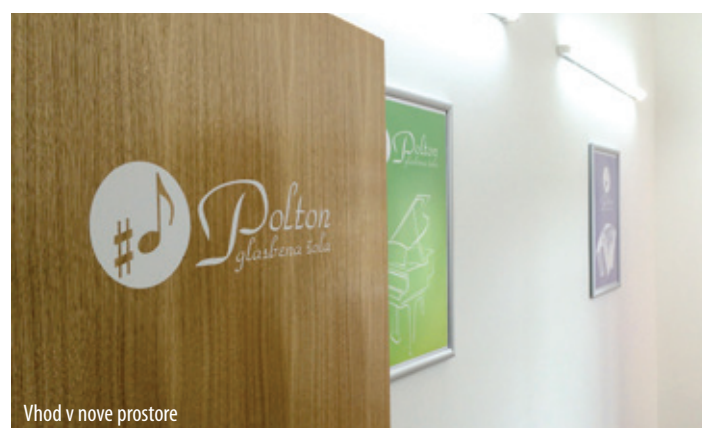
Vhod v nove prostore