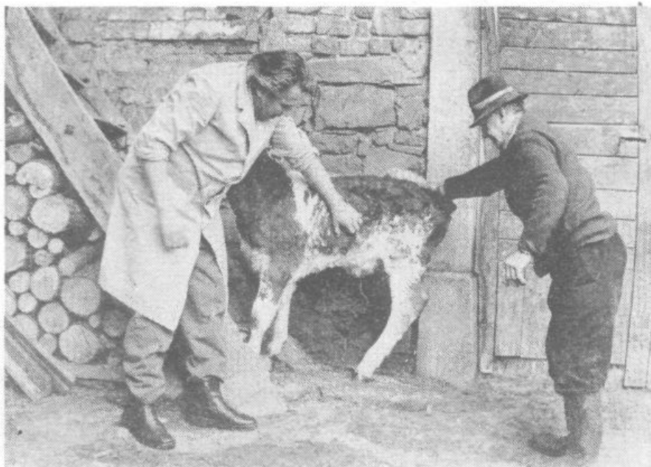
Za operacijo gnojne bule na teličku so Rusovi iz Notranjih Goric plačali 135 dinarjev za storitev, 105 dinarjev za zdravila in 162,50 dinarjev za prevoz. Franc Vilar je to razmerje komentiral z besedami: »Hribovec je vedno revež.«