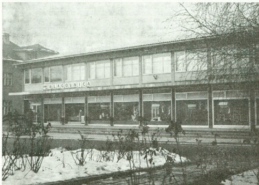
Adaptirana blagovnica v Šentjurju

8000 dinarjev prometa na prebivalca imajo prav vse obmejne občine: Sežana, Koper, Nova Gorica nad 10 tisoč, Piran, Izola in Tolmin nad 8 tisoč. Pri ljubljanskih občinah sta razen Centra nad prepričjem še občini Bežigrad in Šiška tako, da je v primorskih občinah trgovina večja kot v ljubljanskih razen Centra.