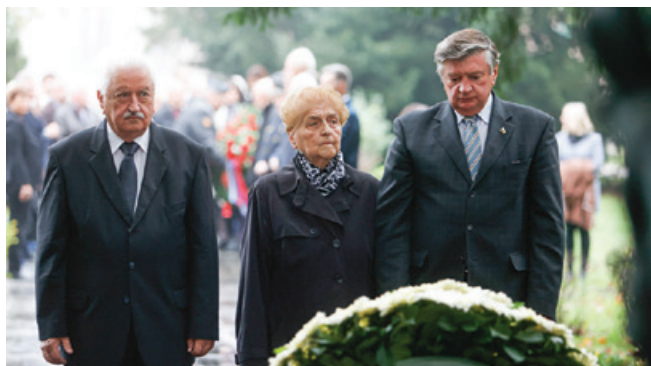
Komemoracija pri Grobnici narodnih herojev

Tako kot vsako leto smo v ljubljanski borčevski organizaciji združili moči z mestno občino Ljubljana in veteranskimi organizacijami, združenimi v KOD-VOS, in se skupaj poklonili spominu na usmrčene v Kozlarjevi gošči, Gramozni jami, na sv. Urhu, vsem padlim pa tudi pri Grobnici narodnih herojev, v Spominskem parku na Žalah, pri Kostnici padlim v prvi svetovni vojni in ne nazadnje smo se poklonili tudi padlim v vojni za Slovenijo. Na komemoracijah so številne delegacije ob pozdravu častne straže Slovenske vojske in praporščakov ter žalni koračnici Orkestra slovenske policije položile cvetje.