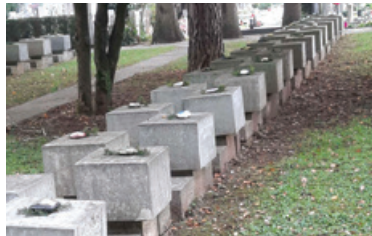
Ljubljanske Žale Dan spomina na mrtve