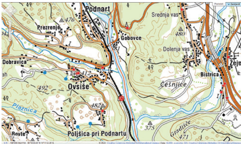
Na Geopediji je z zvezdico označen spomenik šestnajstim padlim ob Savi pri Podnartu.