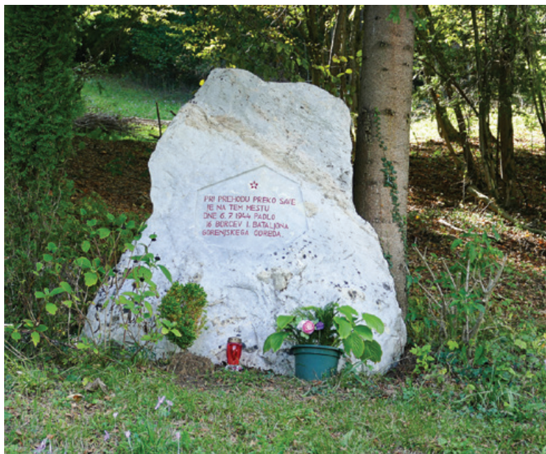
Očiščen spomenik ob železnici na relaciji Podnart-Kranj

premočena partizana, ki jima je uspel beg v nasprotno smer, v hrib. Mama jima je skuhalo žgance in priskrbelo suha oblačila in po nekaj urah počitka sta v bližnjem gozdu že dobila zvezo s partizani, za kar je poskrbel oče.