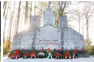
S spominske slovesnosti v Kozlarjevi gošči