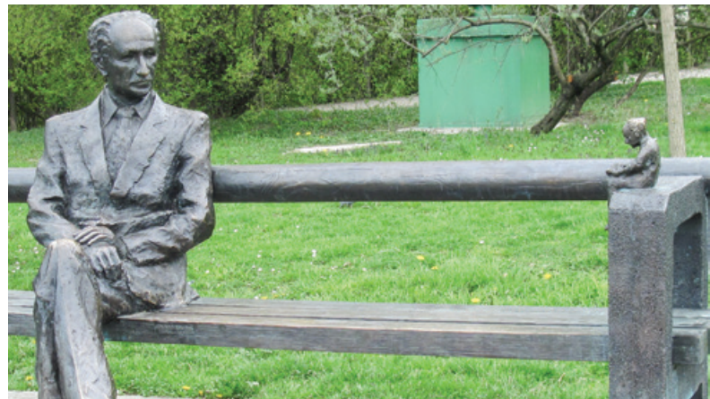
Spomenik Kocbeku v Tivoliju v Ljubljani

Edvard Kocbek (1904–1982) je bil ena najvidnejših osebnosti slovenskega partizanskega gibanja, predstavnik krščanskih socialistov v Osvobodilni fronti, podpisnik znamenite Dolomitske izjave, po vojni nosilec pomembnih političnih funkcij. Kocbek, rojen pri Sv. Juriju ob Ščavnici, je najprej študiral teologijo, a je študij opustil in zatem študiral romanistiko v Ljubljani, Berlinu in Parizu. Služboval je kot profesor francoščine in se v Ljubljani dejavno vključil v slovensko kulturno in politično življenje. Kot ugleden katoliški intelektualca je že pred drugo svetovno vojno veliko objavljaj, med drugim je v reviji Dom in svet objavil esej Premišljevanje o Španiji. V njem je analiziral boj med uporniki generala Franca in špansko republikansko vlado, pri čemer je bila njegova razlaga