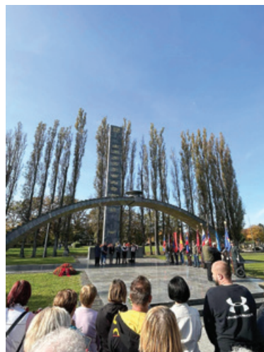
Spomenik v Gradcu, na katerem so imena 1213 umrlih Slovencev.