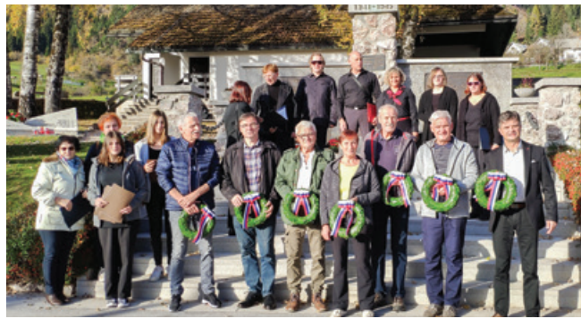
Žalna slovesnost v spominskem parku na Dovjem

ZB za vrednote NOB Dovje - Mojstrana, Kranjska Gora in občina Kranjska Gora sta 29. oktobra pripravila žalno slovesnost pred dnevom spomina na mrtve pri spomeniku prvi in drugi svetovni vojni v spominskem parku na Dovjem. Poklonili smo se spominu ob 80. obletnici smrti devetih udeležencev decembrske vstaje, krajanov KS Dovja - Mojstrane, ki so bili obsojeni na smrt in ustreljeni na poligonu v Dragi, spominu na umrle v raznih koncentracijskih taboriščih po vsej Evropi in spominu na vse padle borce.