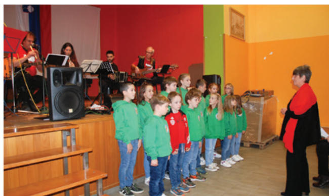
Koncert v polni dvorani na Gorjanskem