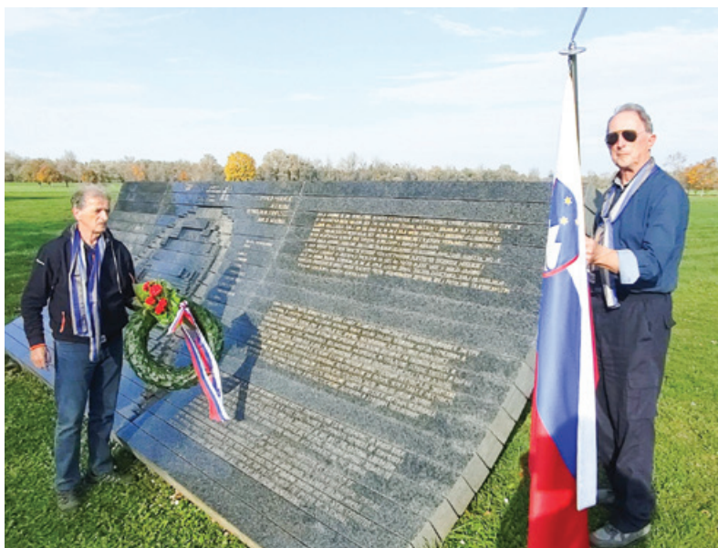
Delegacija slovenske borčevske organizacije je venec položila tudi v spominskem parku Donja Gradina.