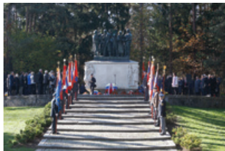
Spominska slovesnost na Sv. Urhu

Kozlarjeva gošča, Gramozna jama, sv. Urh in še bi lahko naštevali. To so kraji na obrobju Ljubljane – mesta heroj, ki so med drugo svetovno vojno okupatorju in njegovim domačim pomagačem služili za najhujša mučenja in ubijanje Ljubljančanov ter prebivalcev okoliških krajev.