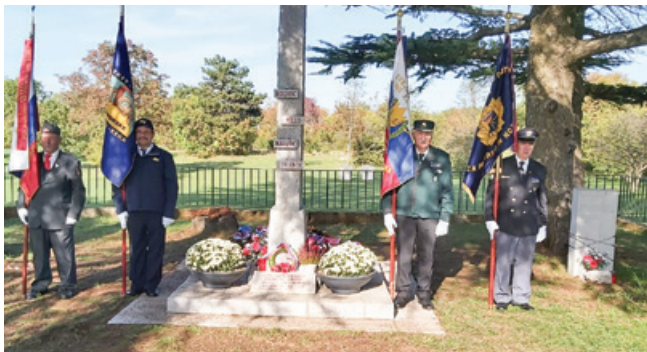
Praporščaki pri spomeniku bazoviškim žrtvam

Delegacije kraških občin, ki so jo sestavljali predstavniki ZZB NOB Sežana in Komen, PVD SEVER za Primorsko in Notranjsko, OZVVS Krasa in Brkinov