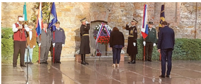
Poklon žrtvam v tržaški Rižarni

Na posameznih lokacijah so naše delegacije pričakali lokalni predstavniki ANPI (Združenje partizanov Italije) oziroma predstavniki lokalnih občin; župani, občinski svetniki in predstavniki civilne zaščite. Na lokacijah Bazovica, Rižarna, Trst – Sv. Ana pa so na komemorativnih slovesnostih sodelovali tudi praporščaki veteranskih društev SEVER, ZVVS, ZZB NOB, društva TIGR in ANPI.