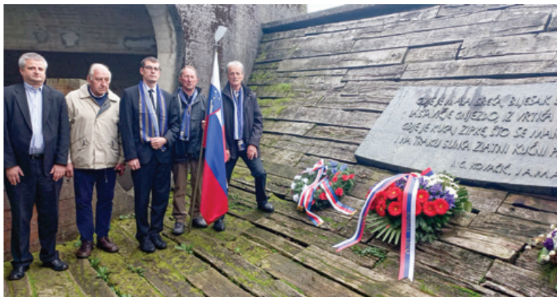
Venec pri spomeniku Kamniti cvet je v spremstvu delegacije ZZB NOB Slovenije položil veleposlanik R Slovenije na Hrvaškem Gašper Dolžan (tretji z desne).