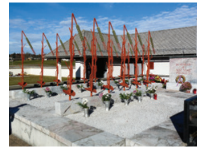
Spomenik padlim na Srednji Dobravi pri Kropi

Naj ta žalostna izkušnja navda s pozornostjo vse tiste, ki kulturni program za proslave zaupljivo