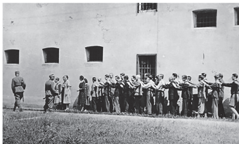
Na slovenskem Štajerskem je bilo med vojno v 67 skupinah ubitih 1590 ljudi.