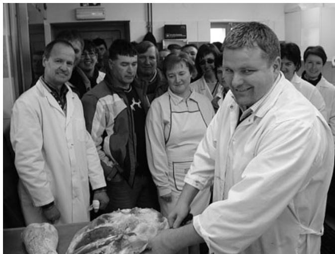
Praktično usposabljanje v mesno-predelovalnem obratu Lipič-Passero v Tešanovcih.

Nekateri izmed tečajnikov načrtujejo eno od oblik dopolnilnih dejavnosti na kmetiji, drugi pa bi si na ta način radi samo utrdili splošno znanje o predelavi mesa. Petrovičeva zaključuje, da je uspešno opravljen tečaj eden od pogojev za pridobitev nacionalne poklicne kvalifikacije s tega področja. Kandidati, ki jo želijo pridobiti, morajo po znanih navodilih pripraviti zbirno mapo, vanjo pa morajo vložiti tudi potrdilo o uspešno opravljenem tečaju. O tem potem odloča posebna strokovna komisija, ki po potrebi kandidata povabi tudi na zagovor.