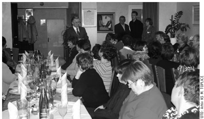
MORAVSKE TOPLICE – Proslave ob dnevu žena v organizaciji krajevne skupnosti se je udeležilo 62 žena in deklet.