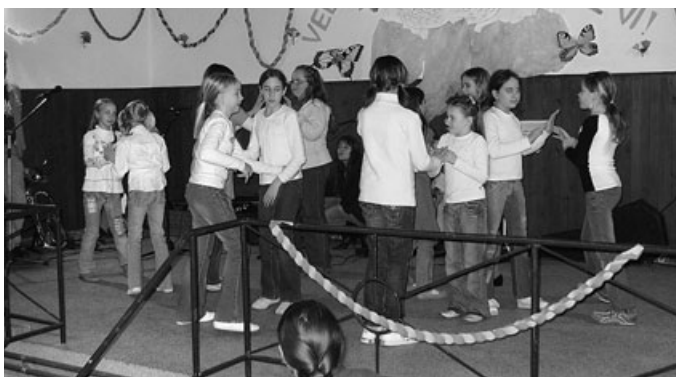
VUČJA GOMILA – V čast ženam in dekletom ob dnevu žena in materinskem dnevju so zaplesali tudi učenci OŠ Fokovci.

Vse redke mlake na Goričkem danes predstavljajo pomemben del naravne dediščine pokrajine in so s svojo biotsko raznovrstnostjo tudi pester naravni ekosistem. Dokumentacijo za revitalizacijo izvirne mlake na Makoterjevem bregu v Selu, ki leži v območju Natura 2000 in v Krajinskem parku Goričko, sta na pobudo Društva geografov Pomurja pripravili Občina Moravske Toplice in OŠ Fokovci, izpeljali pa so jo ob finančni pomoči Heliosovega sklada. Zasnovo obnove mlake z ekoremediacijskimi metodami je pripravil Mednarodni center za ERM na Filozofski fakulteti v Mariboru. Obnovitvena dela na mlaki so v štirih delovnih akcijah potekala od poletja 2007 in jih je ob pomoči prebivalcev Sela izvajalo društvo geografov.