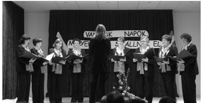
Színes és minőséges program jellemző az idei központi nemzeti ünnepre.