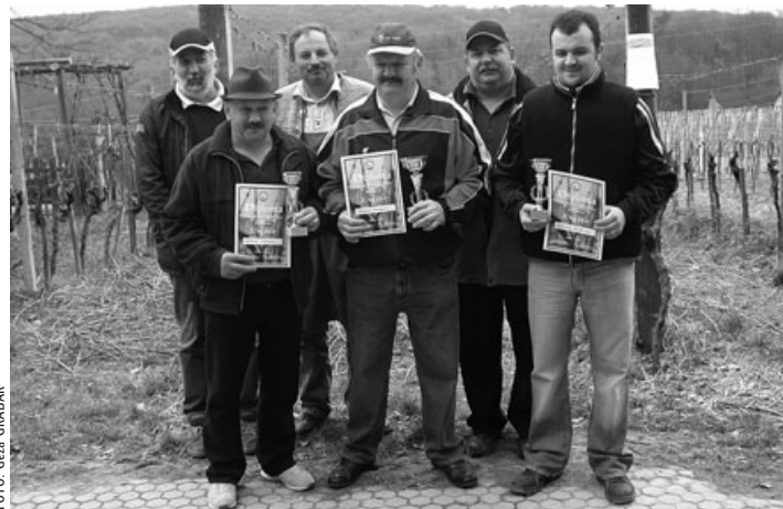
Najboljši rezači z organizatorji (od leve):

Vino za pokušino bo nared približno čez leto dni, ko naj bi slamno vino napolnili v posebne, 2,5-decilitrske steklenice. (G.G.)