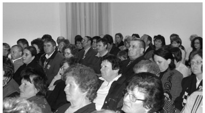
A márciusi hagyományhoz hően a gorickóiak és vendégeik az utolsó helyig megtöltötték a pártosfalvi faluotthon dísztermét.