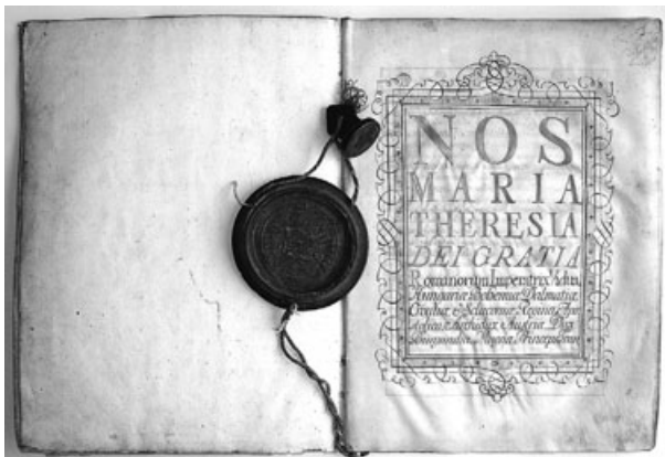
Bogojinska cehovska pravila iz leta 1779: prva stran, cesarski pečat in štampljka cehov.

Seveda je bil kraj naseljen že veliko prej, preden je prvič zapisano njegovo ime, morda celo že v času pozne bronaste dobe (1400 do 750 pr. Kr.), o čemer nam priča najdeno bronasto bodalo v njegovi okolici, ali kasneje, v času železne dobe (750 do 400 pred Kristusom), priča je najdba bronaste nazlebljene zapestnice, prav gotovo pa je bilo to področje poseljeno v rimski dobi. Antične gomile v okolici Bogojine in v gozdu nad njo, od katerih je ena še zelo dobro ohranjena (v delu gozda z imenom Falúba), so namreč najboljši dokaz, da je tu živelo avtohtono prebivalstvo. Te gomile so namreč grobišča takratnih tukajšnjih prebivalcev, sodijo pa v čas od 1. do 3. stoletja po Kristusu.