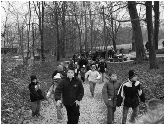
»A Carpe diem – Kerékpárral két völgyön át« szlovén-magyar közös projekt februárban Pártosfalván a Matzenau tanösvény megnyitásával ért véget. A képen az iskolások egy csoportja az erdei ösvényen menetel a kúria irányába.