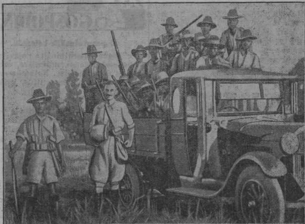
Upor proti angleški oblasti v Burmi v Indiji. Slika nam kaže angleško kolonijalno infanterijo, ki čaka v avtomobilu na povelje za napad.

Bramorje odpravite le s pridno roko. Treba je vrt globoko prekopati, najdene bramorje pobiti, poiskati gnezda in uničiti jajca in ličinke. V spomladi napravite globoke jame in jih deloma napolnite proti večeru s toplim konjskim gnojem. V poletnem času pa v skopane jame položite lonce, v katere dajte vabo — par črvov. V obeh slučajih je treba bramorje zjutraj zgodaj pobiti, da ne uidejo. Bramorji namreč ljubijo gorkoto in bodo zlezli v gnoj, ker so pa tudi požrešni, bodo iskali črve v loncih. Strupi pa niso priporočljivi, ker je to dvorezno sredstvo. Uspeh boste imeli pa le takrat, če bodo tudi vaši sosedi bramorje preganjali.