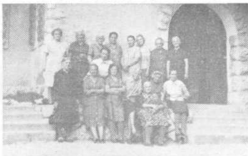
Za spomin s prijetnega letovanja

Vendar pa na Srednjem vrhu še zdaleč ni bilo dolgčas, za kar so vsekakor poskrbeli pionirji in pionirke, učenci šišenskih šol, ki so delali družbo starejšim občanom. Pa so se kar dobro razumeli, saj so otroci zadnji večer svojim starim prijateljem celo pripravili prijeten program recitacij in petja, ki bo vsem ostal še dolgo v spominu. Ob prisrčnih interpretacijah otrok so se marsikomu orosile oči in ob koncu so vsi želeli, da bi se še kdaj srečali. »Radi smo vas imeli in pogrešali vas bomo«, je vzkliknila neka deklica v slovo.