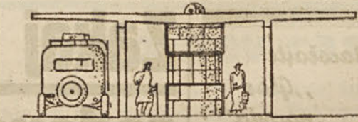
Pogled na avtobusni kolodvor od strani

rokem postajališče bi bila pod streho dva paviljona za garderobo in za blagajno za izdajanje vozniških listkov ter za servis za avtomobile in bencinski tank. Pod tem peronom je mišljeno tudi javno stranišče v tleh, vendar bi