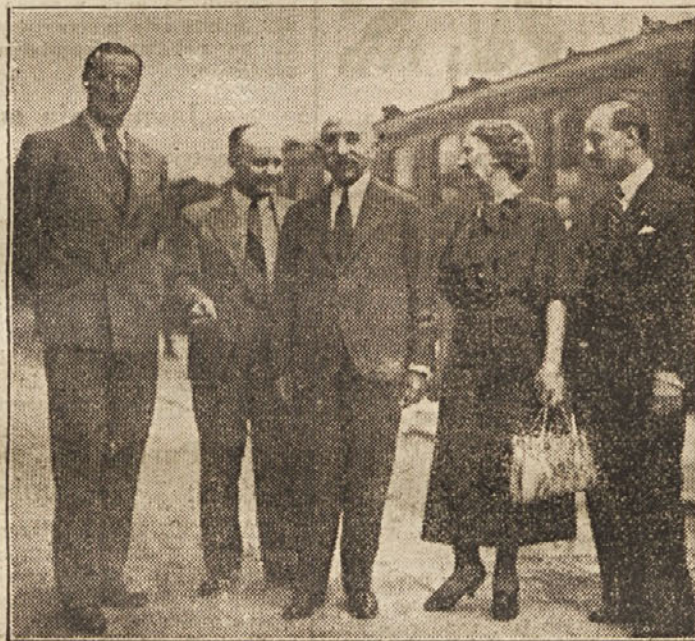
Grški ministrski predsednik Tsaldaris