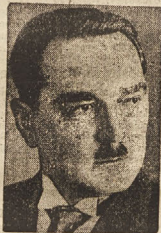
Dr. Milan Stojadinović

s soprogo, šefom kabineta Pipinelisom in ostalim spremstvom čaka na Ljubljanskem glavnem kolodvoru, da ga brzovlak odpelje dalje v Bohinj.