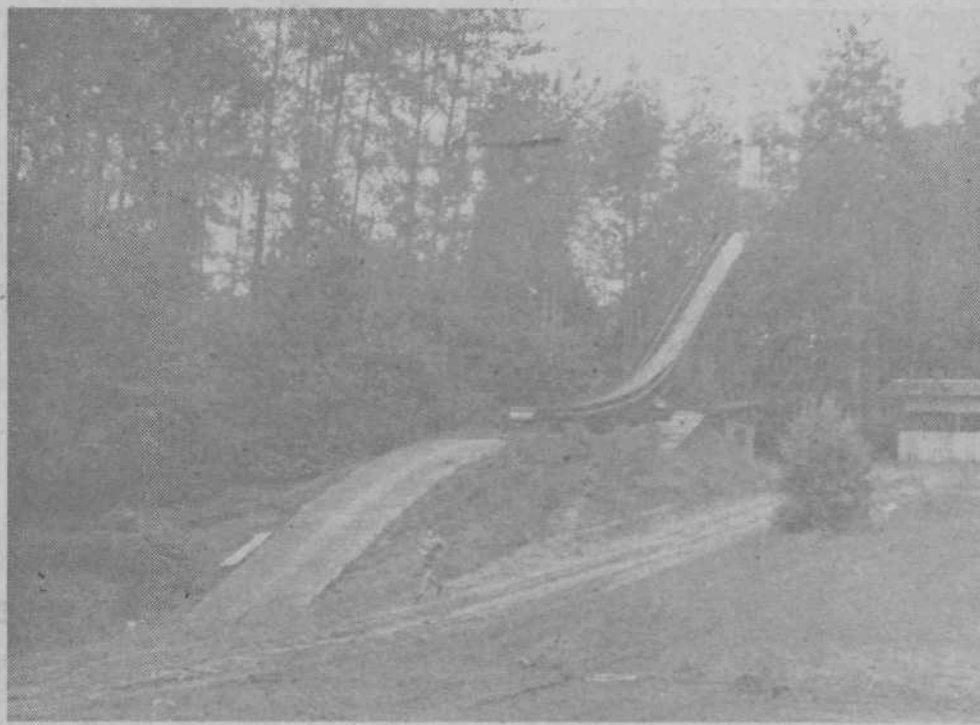
Skakalnica iz plastike na Korantu nad Dolom.