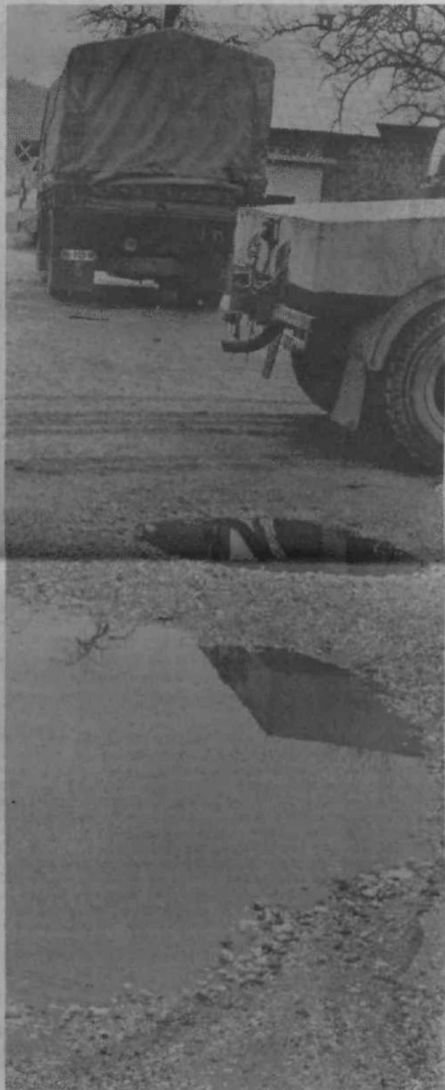
KO BO MRAZ MIMO, BODO OSTALE LUKNJE – iz izkušenj vemo, da ima zima še eno neprijetno posledico: cvetenje cest. Kaj moremo – zima in gosposka ne prizaneseta, pravi pregovor.

Da, takrat je bilo natanko tako. Začel je naletavati sneg, snežinka na snežinko, celo noč je medlo in jutraj so bile neasfaltirane ulice bele in mehke. Tlačani in svobodni meščani so tacali po beli preprogi, jo dodobra rahodili, pa tudi težki parizarji so utirali svoje kolesnice po razhojenih ulicah. Vse se je spremenilo v brozgo. Pa je nastopil večer in pritisnil je mraz, takole dvanajst pod ničlo, cesar takratni meščani še niso vedeli, in ulice so se spremenile v zglajeno površino, ki se je strupeno svetlikala v mesečini. Tedaj se je začelo: graščaki in tlačani, črnošolci in rokodelci, celo konji – vsem je začelo zmanjkovati tal pod nogami. Pokale so kosti, lomile so se trdoglave srednjeveške butice in blagorodni gospodje so