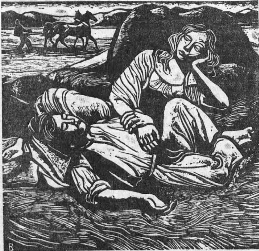
Počitek po trudapolnem delu na polju...