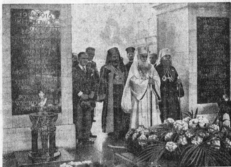
Pretekli teden je obiskal romunski ministrski predsednik patrijarh Miron Christea poljsko prestolico Varšavo. Ob tej priliki je imel več razgovorov s poljskimi državniki. Na podobi vidimo patrijarha Mirona, ko je položil venec na grob neznanega vojaka v Varšavi.

Ajd se je znova ustavil, na hitro, kakor da bi ga kdo poklical.