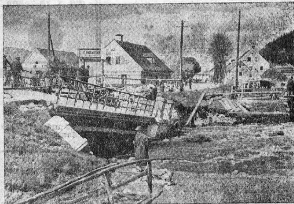
Podoba uničevalnega dela reke Mure, ki je pretekli teden zaradi deževja prestopila bregove in se razlila ob bregovih čez travnike, njive in polja. Poplavlila pa je tudi več vasi ter prebivalstvu prizadela veliko škodo.

Marsikdo, ki je že videl Arc de Triomphe v Parizu, si niti misli ni, da se nahaja pod teraso slavaloka lepa dvorana, ki nudi prekrasen pogled preko Pariza. V tej dvorani so sedaj namestili historično razstavo, ki vsebuje slike in spomine na vse slavnosti, ki so se vršile ob slavaloku v zadnjih petdeset letih.