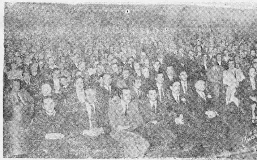
Občinstvo na prireditvi U. S. J., dne 4. oktobra t. l.

Prizor iz igre "Junaska žena" ki je bila podana na prireditvi U.S.J. 4. okt. t. l.