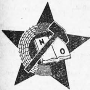
Escudo de la Juventud Popular Yugoslava