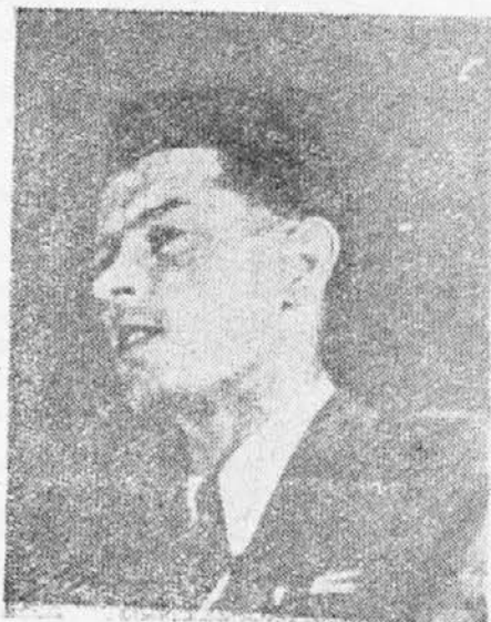
RATO DUGONJIĆ, Presidente del Consejo Central de la Juventud Popular Yugoslava.

Informe presentado por Rato Dugonjić, Presidente del Consejo Central de la Juventud Popular Yugoslava, al Tercer Congreso de la organización, ocasión en la que fué elegido por unanimidad para el cargo que ocupa.