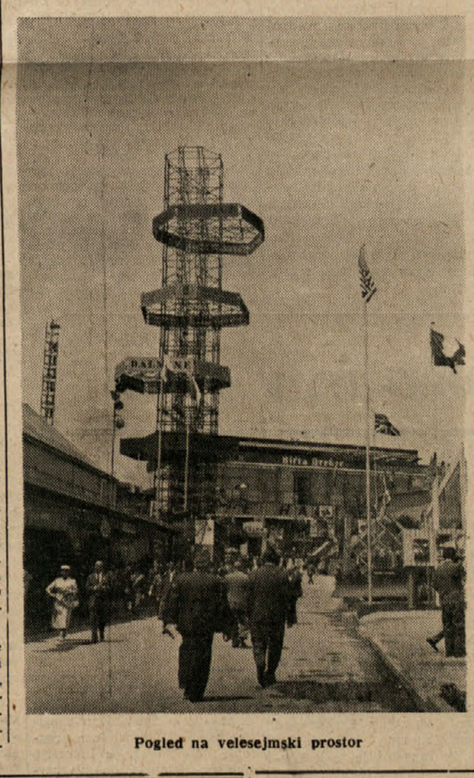
Pogled na velesejmski prostor