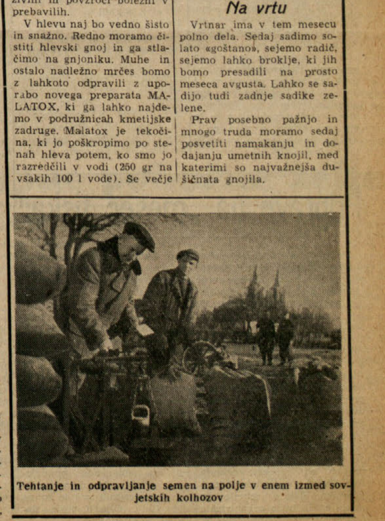
Tehtanje in odpravljanje semen na polje v enem izmed sovjetskih kolhozov

merov 'pokazuje različne znake, ki nimajo nobene zveze z otroško paralizo, so pa resni in jih še vedno raziskujejo ter so zdravniki o tem različni mnenj. Najtežje je to, da je letos umrljivost posebno visoka in je dosegla 22 odstotkov obolenih. Edino možno zdravljenje je simptomatično in profilaksija je enaka pri vseh teh obolenjih, ki zadevajo možgane in hrbtenico. Zdravstvene oblasti so poskrbele za prevoz vseh obolenih v otroško bolnico Burlo Garofalo, kjer so strogo ločeni od ostalih, da se prepreči prenašanje bolezni na druge. Ukinjeno je bilo tudi vsako cepljenje, ki bi lahko omogočilo infekcijo. Vendar pa se te bolezni ne prenašajo z neposrednim kontaktom, temveč nosijo vsi otroci te zametke v sebi in se le pri nekaterih iz nepoznatih razlogov razvijejo. Zaradi tega ne bodo letos kolonije ukinjene, ker ne predstavljajo nobene nevarnosti; če bi kakšen otrok v kolonijah zbolel pomeni, da bi bil zbolel tudi, če bi bil ostal v mestu. Zelo težavno je bilo delo za pobiranje sladkorne pese. Marsikdaj se zaradi težav priprave ni pravčasno spravil. Z uvedbo novega kombajnja za pobiranje sladkorne pese so bile te težave odpravljene. Kombajn spravi na svetlo peso do korenin, jo pobere,