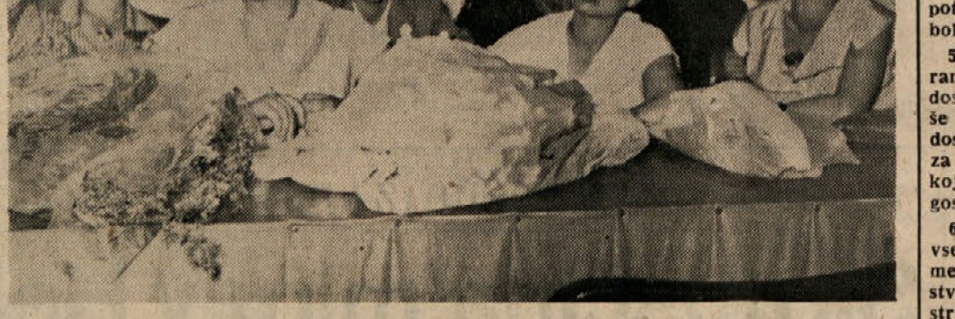
Predsedstvo kongresa tržaške žene