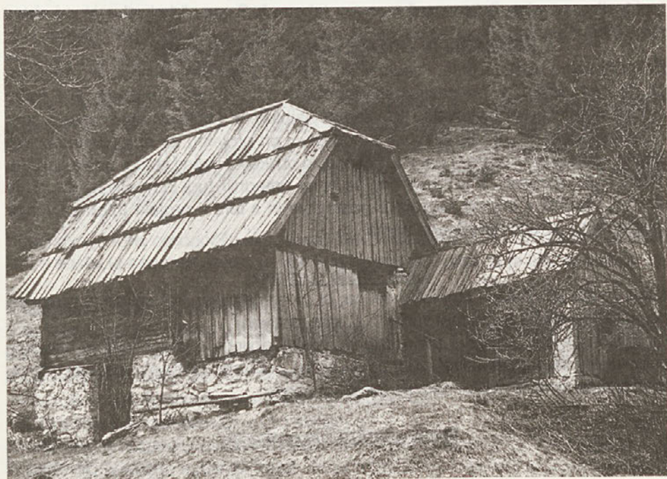
Trentarska domačija v Zapodnu v Trenti

konkreten primer razvoja neke doline in dolgoročnega vpliva človekove naselitve na naravno ravnovesje v določenem kraju. Vsebinsko se bo zbirka Trentarskega muzeja prilagajala konceptu Informativnega centra v poudarku na univerzalnem sporočilu naravnih parkov sploh: nekoč je bil človek dovolj šibak, da se je ravnovesje v naravi vzpostavljalo samo po sebi; danes je človeštvo dovolj močno, da lahko uniči naravo; zato je potrebno to ravnovesje zavestno iskati in vzpostavljati. Načini iskanja in vzpostavljanja so različni - splošni ekološki zaščitni zakoni, naravni parki kot posebna zaščitena območja, spodbujanje posebnih oblik gospodarstva (v primeru Trente npr. ovčjereje), uvajanje mehkega turizma. Poudarek pri tem je na zavestni odgovornosti posameznika in splošne družbeno-politične skupnosti. Naravni parki ravnovesje vzpostavljajo na širšem območnem nivoju "divjina - kulturna krajina - mesta", na mikronivoju pa mora takorekoč vsaka dolina ali vsak kraj iskati svoj način, iz katerega v končni posledici izhaja tudi identiteta kraja. Zbirka Trentarskega muzeja v mansardi Informativnega centra, ki jo zdaj postavljamo, nima torej le prezentacijskega namena razstave predmetov kulturne dediščine Trente ali raziskovalnega namena razkrivanja posameznih strukturnih oblik načina življenja, pač pa tudi vzgojno-pedagoški namen s katerim se poskuša vključevati v današnji družbeno-politični trenutek. Koliko nam bo to uspelo, pa je seveda še vprašanje.