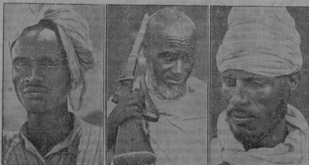
Obrazi iz Abesinije. Od leve na desno: abesinski nosač, star bojevnik in učitelj.