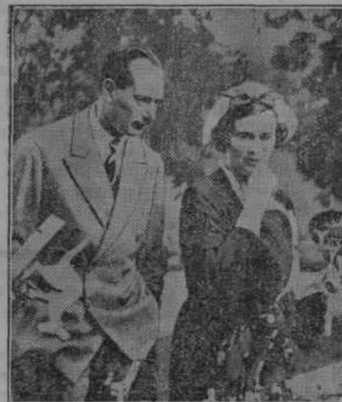
Tretji sin angleškega kralja se je zaročil s hčerko znamenitega angleškega vojvode. Zaročenki je ime Alice.

„JUGEFA“ K. D. Zagreb, Preradovičeva ul. 16 Oddelek za zaščito rastlin