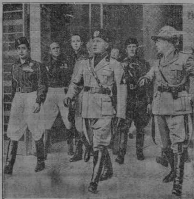
Mussolini po prevzemu poveljstva nad velikimi italijanskimi manevri na Tirolskem.