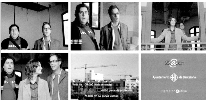
Slika 4: »Več kot 100.000 delovnih mest, 4000 subvencioniranih stanovanj, 75.000 m 2 zelenih površin. 22@BCN.« TV-reklama mestnega sveta Barcelone in Barcelona Activa. (Vir: Barcelona Comunica, Ajuntament de Barcelona)

Vendar naš namen v sklepu seveda ni vredno-