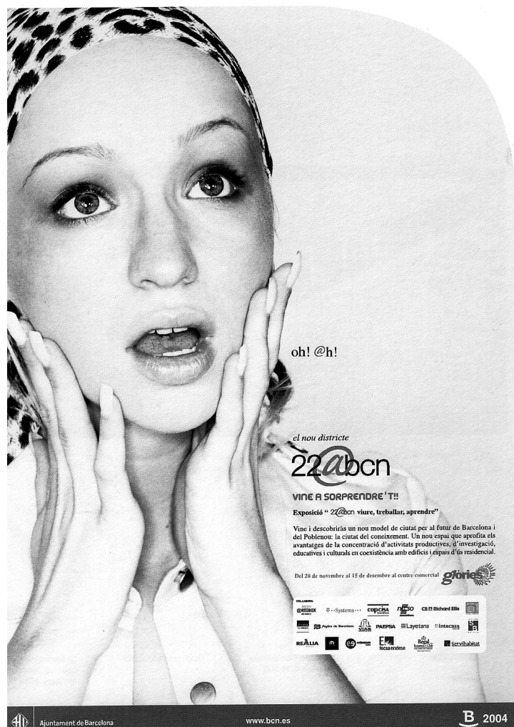
Slika 3: »Oh! @h! Nova soseska 22@. Pridite in se pustite presenetiti!« Plakat mestnega sveta Barcelone za promocijsko razstavo 22@BCN. (Vir: Barcelona Comunica, Ajuntament de Barcelona)

Vir: Ajuntament de Barcelona, Departament Estudis i Avaluació, Baròmetre Trimestral