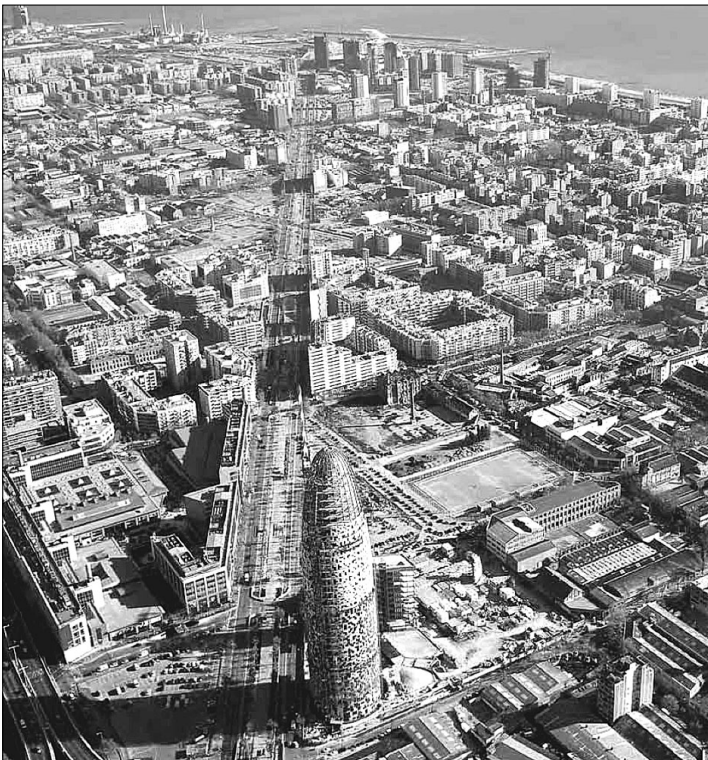
Slika 2: Območja »nove središčnosti«. V ospredju stolp Agbar, v sredini območje 22@, zadaj Diagonal-Mar s Forumom 2004. (Vir: The 22@ Project , Ajuntament de Barcelona, 22@ BCN, S.A.)

Projekt Districte d'Activitas 22@BCN (v nadaljevanju 22@) je eden dolgoročno najambicioznejših razvojnih projektov v barcelonski mestni regiji. Njegov cilj je omogočiti pravkar omenjeno prostorsko in funkcionalno zgostitev najuspešnejših in najhitreje razvijajočih se proizvodnih sektorjev, storitvenih, logističnih