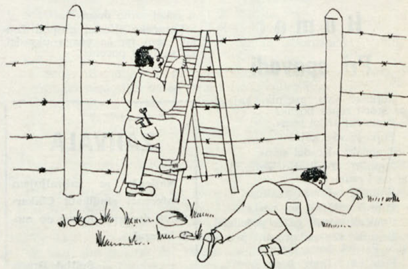
Pohiti, da ne bova zopet zamudila službe