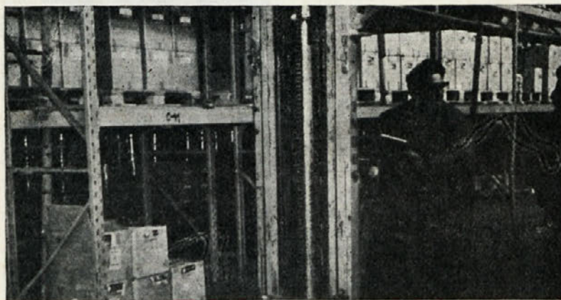
Skladiščeni izdelki TOZD Grafike na regalnem sistemu.