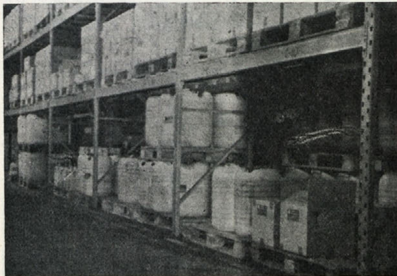
V uporabi imajo le en vilicar. Če ta zataji, si ga morajo sposoditi v javnih skladiščih, uporabo zanj pa drago plačevati.