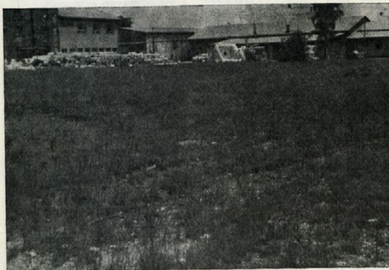
Tukaj bo morda nekoč stala obljubljen in težko pričakovana razdelilnica toplega obroka