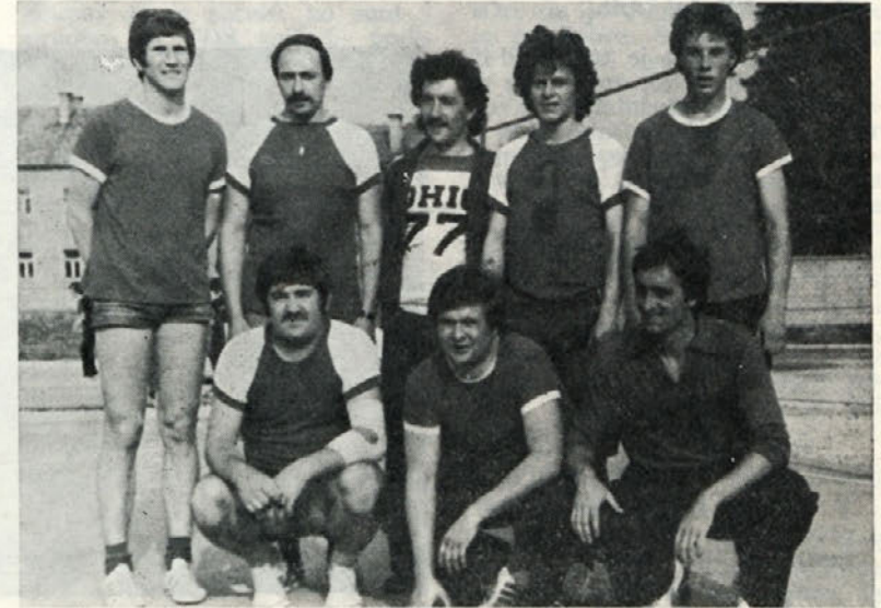
Ekipa Vzdrževanja je osvojila 1. mesto

V finalu so se pomerile med sabo prva iz A skupine proti prvi iz B skupine za prvo in drugo mesto, druga z drugo za tretje in četrto mesto, itd.