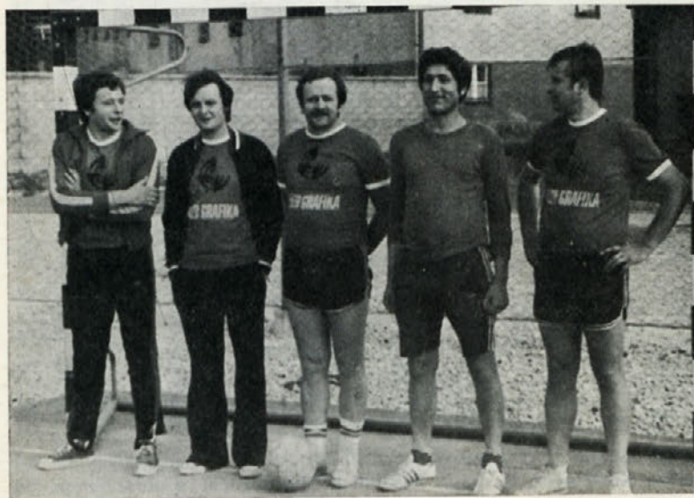
Nogometaši Grafike so zasedli solidno tretje mesto