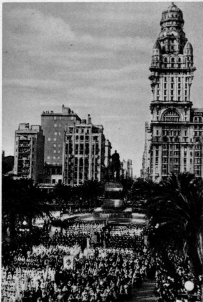
Manifestacija Marijinih družb ob spomeniku generala Aritigas-a v glavnem mestu Montevideo (Urugvaj)

Ko je baron dvignil glavo in videl okrog sebe vse polno ljudi, ga je obšla ena sama