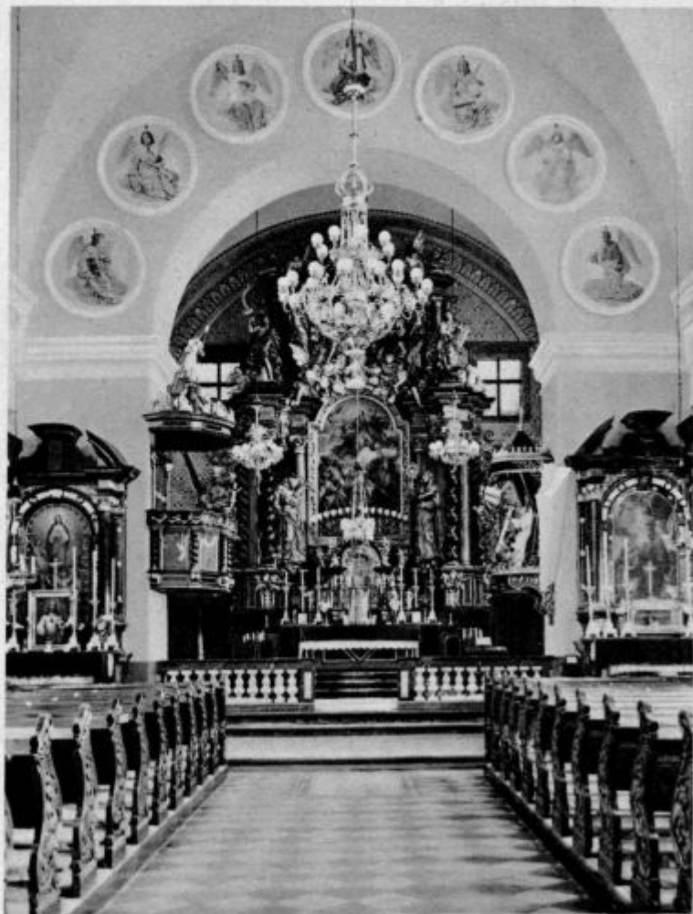
Notranjščina cerkve v Mekinjah pri Kamniku