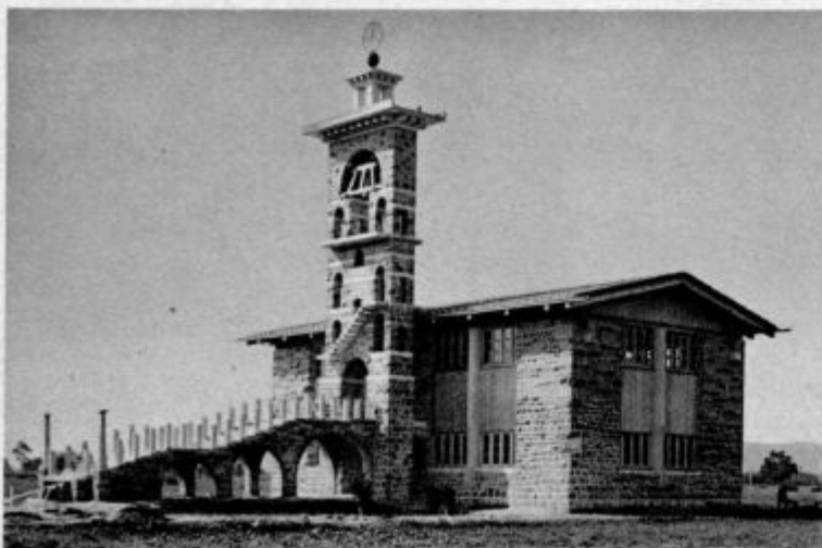
Nova cerkev sv. Mihaela na Barju pri Ljubljani (Prvo žegnanje v tej cerkvi je bilo 2. oktobra 1938. Vhod k svetišču je zvezan z mogočnim stopniščem)

Isti trenutek je videl, kako ga je obkročila skupina znancev, kajti novica o njegovem včerajšnjem napadu se je hitro razširila.