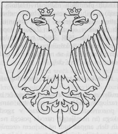
Starejši grb Szécsijev

Slovaška historiografija ponuja precej odgovorov na vprašanja o Szécsijih. Topografske podatke lahko najdemo v mnogih monografijah o gradovih na Slovaškem in splošnih enciklopedičnih tiskih. 34 O izvoru njihovega grba lahko preberemo v delih slovaških (in čeških) zgodovinarjev ter heraldikov Sokolovskega, Nováka in Loude. 35 V geslih Slovaškega biografskega leksikona 36 najdemo osnovne podatke o več članih Szécsijevega rodu. Tudi objavljenih virov je veliko. 37 Sistematično so jih Slovaki pa tudi Čehi začeli izdajati že pred drugo svetovno vojno. Nobena od njih posebej ne izpostavlja Szécsijev, zato je treba podatke o njih iskati v že znanih zbirkah z zelo širokim izborom srednjeveških, pa tudi novoveških listin. Za obdobje prve polovice 16. stoletja (do bitke pri Mohaču), ki ga je na Slovaškem zaznamoval gospodarski vzpon