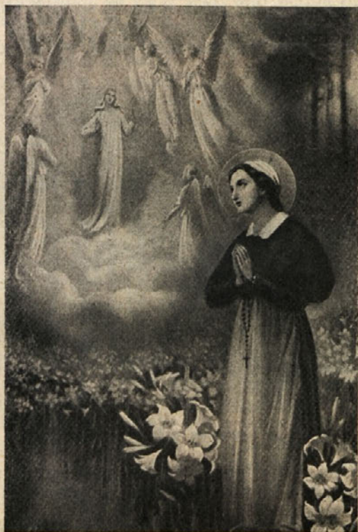
Sv. Angela Merici

gočno lestev, podobno oni, ki jo je videl očak Jakob v puščavi Betel. Z enim koncem se je dotikala zemlje, z drugim pa izginjala v nebesne višave. Po lestvi pa so hodile gori in doli belooblečene device, okrašene s kraljevskim nakitom in prepevale rajskolepe pesmi. Ob njihovi strani pa so se dvigali angeli božji in jih spremljali proti nebesom. Iz zbora devic je pristopila k njej njena umrla prijateljica in ji rekla: »Angela, vedi, da ti je Bog poslal to prikazen in ti s tem razodel svojo voljo, da ustanoviš pred smrtjo v Bresciji družbo devic, ki bo tej podobna. Bog ti to zapoveduje!« Po božji milosti razsvetljena je Angela sedaj spoznala svojo pot, svojo nalogo in svoj poklic.