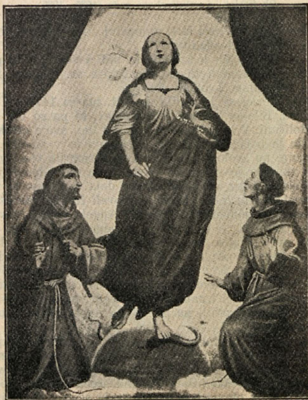
Brezmadežna pozdravljena od sv. Franciška in Dominika

»Sveta devic Devica!« — Od dni, ko je živela Marija na zemlji, imajo v njej popolen vzor vsi, ki ljubijo čistost srca. Ena je in edina med človeškimi otroci, katere se ni nikdar dotaknil greh. Tisočletja je pripravljala Bog človeški rod na prihod svojega Sina in na njegovo brezmadežno Mater. In po njenem prihodu so jo kot Brezmadežno čistila stoletja krščanstva. Vse, kar je v stoletjih zvenelo iz tisočerih izrekov kot klic splošnega hrepenenja ... kar je blestelo kot skrita zlata ruda v sv. pismu, pa še ni bilo dvignjeno, vse je bilo 8. decembra 1854. ostvarjeno in dovršeno, ko je Pij IX. proglasil brezmadežno spočetje Device Marije za versko resnico.