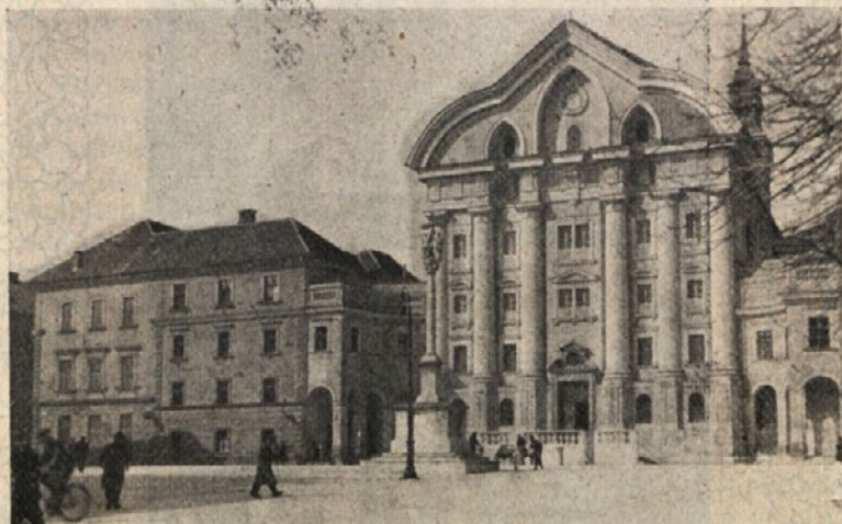
Cerkev in samostan uršulink v Ljubljani

Ko je neko noč kot ponavadi molila, je naenkrat zagledala, da se ji bliža angel z bičem v roki. Prestrašila se je, se z obrazom sklonila do tal in čakala na kazen. Ko pa je zopet dvignila svoj pogled, je videla pred seboj Jezusa, ki ji je govoril z ostrim glasom: »Kje je tvoja vera? Ali še po tolikih in tako jasnih znamenjih nisi spoznala moje volje? Kaj naj mislim o tvoji gorečnosti in zatrjevanju zvestobe?« Te besede so pretresle njeno dušo. Prvi odgovor je bil potok solza, ki so se ji vtilile po licih. Jezusove besede so bile sicer ostre, a njegov pogled je bil mil in ljubezni poln. Angela je prosila z velikim zaupanjem: »Pozabi, o Gospod, vso nezvestobo