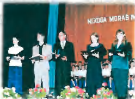
Per fotografji so deli priznani na akademiji