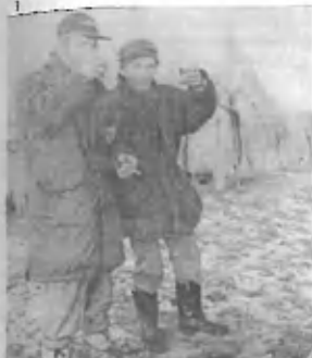
Marjan in Edo sta za radi ravnanja šnopsmalije precej pobris, vendar turabu nazdravljata boljšim časom. Fanta, eks veljal!