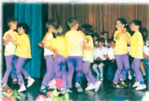
Nastop plesne skupine vrtač izobica Trzin