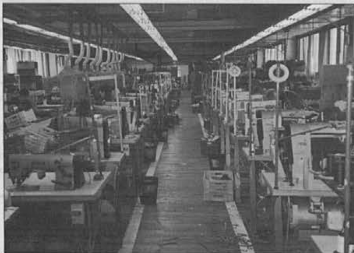
Sodobna organizacija dela v obratu na Colu