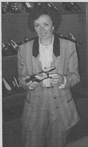
Prvi par se v Alpini dobi zastoj