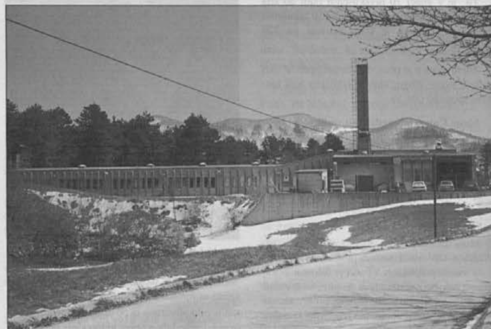
Sedanja tovarna na Colu – odprta pred petnajstimi leti