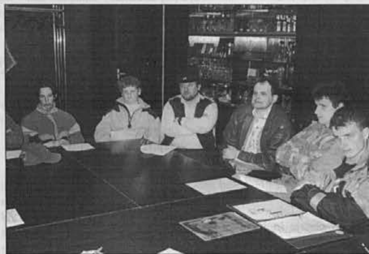
Z ustanovnega občnega zbora Roler kluba Alpina

8. aprila se je v Sindikalni dvorani zbralo petindvajset mladih ljudi, vodilnih in drugih strokovnjakov Alpine – in ustanovili so Roler klub Alpina.