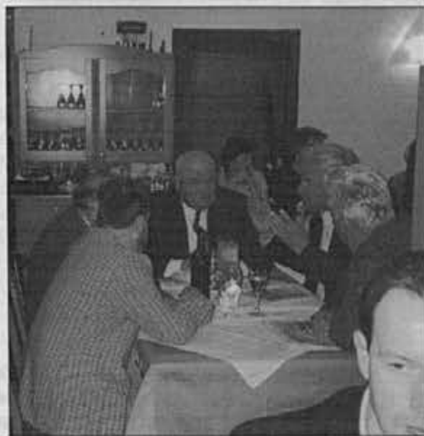
Pogovoriti se je treba - kako je bilo včasih

Organizirati se, da bomo uspešni: od selekcije programov, delitve dela v panogi,