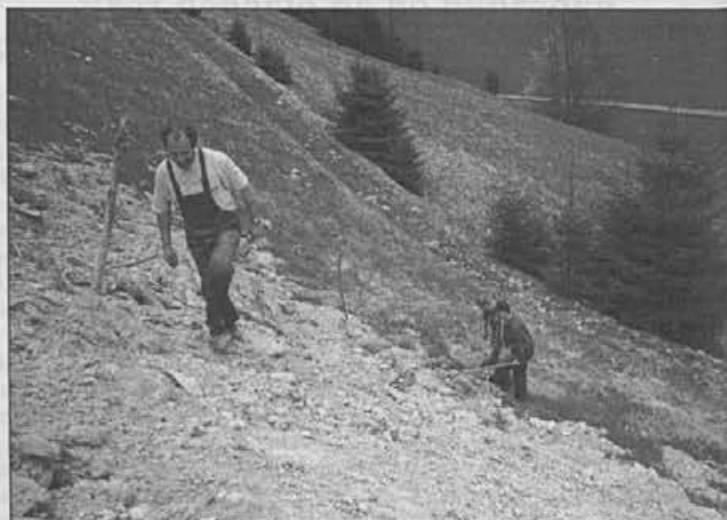
Mirko Mlinar in sovaščani pri pospravljanju sosedove senožeti