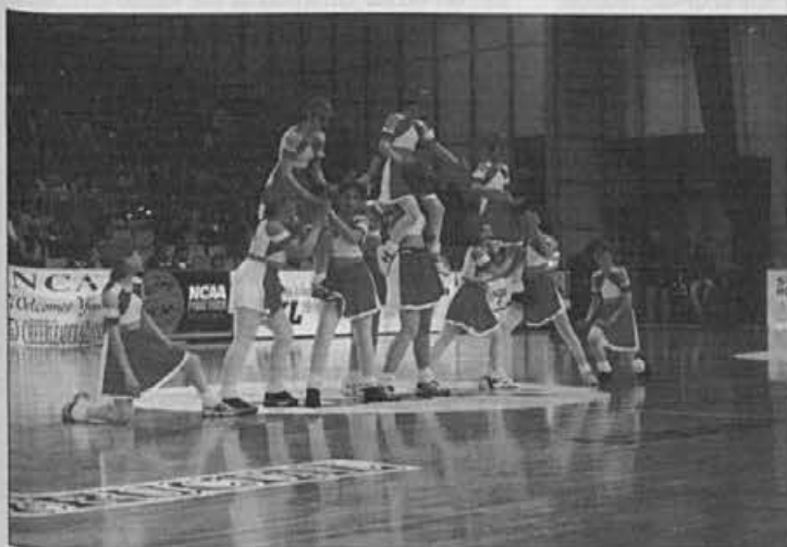
Tudi navijačice so pripomogle k uspehu