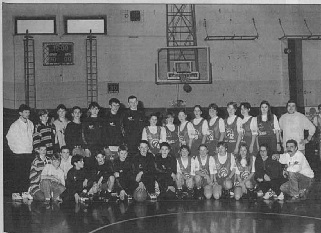
Skupne ekipe košarkaric in košarkarjev osnovne šole Žiri – s trenerji in ravnateljem