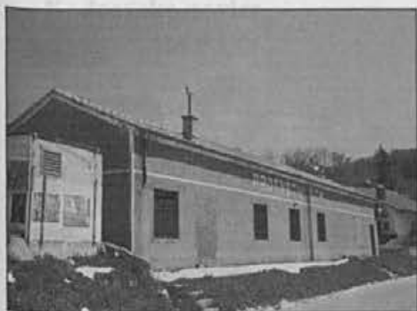
V tej stavbi je leta 1972 začel delovati obrat Alpine

“Ves čas, ko sem bil vodja obrata, je bila v zraku zahteva za izgradnjo nove tovarne, kar se je uresničilo ob 10-letnici obrata.