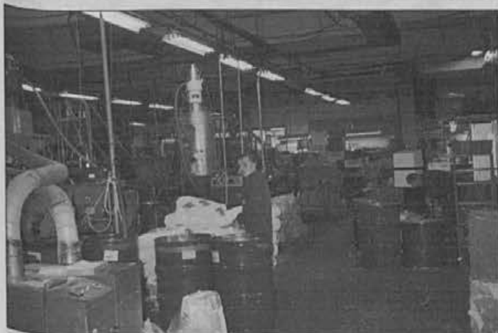
Iz oddelka termoplastov, kjer izmenoma izdelujejo panacerje in rolerje