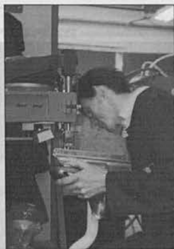
Montirati je treba še podvozje – potem pa bo šlo z vso silo

Seveda je pri rolerjih nekoliko drugačna delitev dela, ker je manj sestavnih delov kot pri smučarskih čevljih. To smo s