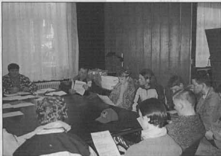
Z ustanovnega občnega zbora Roler kluba Alpina