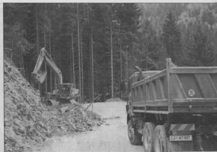
Mehanizacija, pridne roke in veliko denarja – pa je cesta