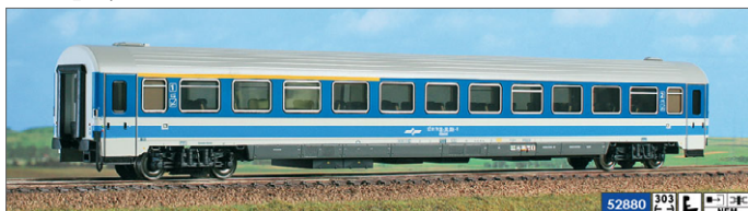
Primer štiriosnega vagona s kupeji

Po letu 1975 so tudi pri nas začeli uporabljati udobnejše štiriosne vagonne s kupeji. S temi vagoni se še danes izvaja promet na daljše razdalje (npr. Budimpešta-Murska Sobota-Ljubljana), so udobnejši in tišji, dovoljena največja hitrost pa je 160 km/h.