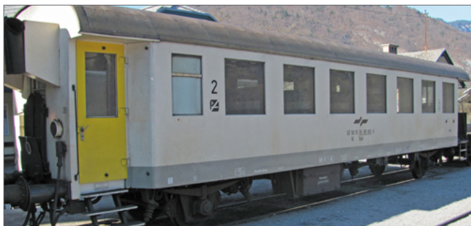
Primer dvoosnega vagona

V času parnih lokomotiv smo se vozili z dvoosnimi vagoni. Bili so z dokaj trdim vzmetenjem, lesenimi sedeži, uporabljali so jih za prevoz na krajše razdalje (lokalne proge). Ti vagoni danes niso več v prometu (izjema je samo muzejski vlak). Njihova največja hitrost je bila 100 km/h.