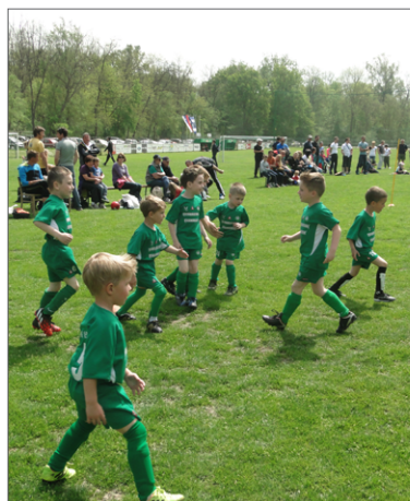
Najmlajši na turnirju