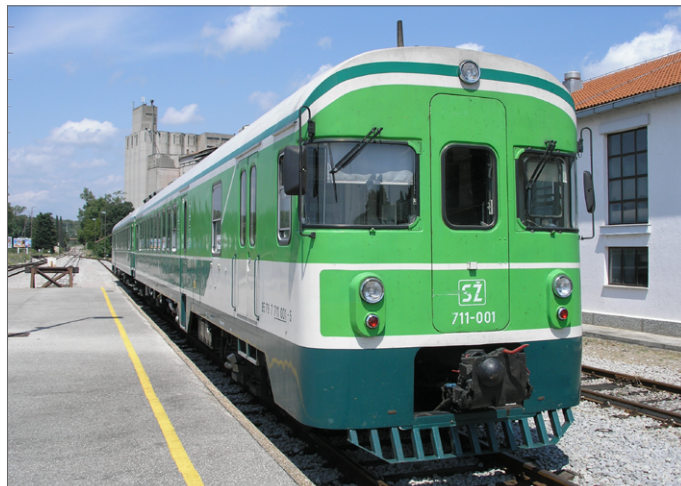
Zeleni vlak »zelenc«

Na daljših razdaljah se danes uporabljajo še dieselmotorne garniture (vlakci), običajno sestavljene iz dveh enot (vagonov). Najbolj razpoznavna med temi garniturami je označena s številko SŽ 711. Vsaka enota ima svoj motor znamke Daimler-Benz (na železnici so jih poimenovali Mercedes), zaradi njene zelene barve pa se je med potniki uveljavil tudi vzdevek zeleni vlak (»zelenc«). Ti vlaki dosega- gajo hitrost 120 km/h.