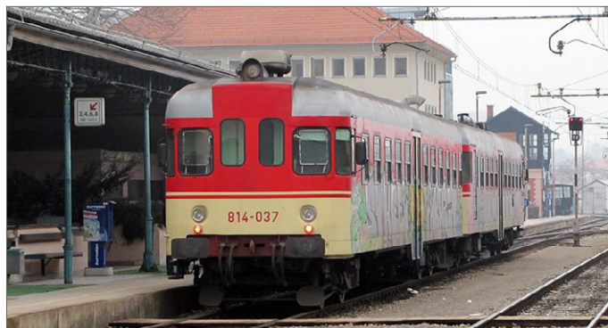
Primer Fiatove garniture