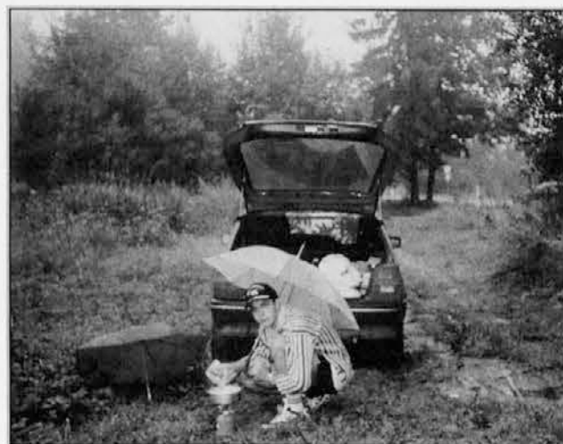
Kuhanje kosila med nalivom ob vznožju Tater

Prva misel je bila, da si poiščeva kak kamping, ker sva s seboj imela šotor; ob pogledu na nebo, ki se je znova začelo oblačiti, pa sva to misel opustila. Treba je bilo najti kakšno poceni streho, ker pa je znano, da je v mestih vse skupaj precej drago, sva se odločila, da greva na podeželje pogledat, če kdo oddaja sobe.