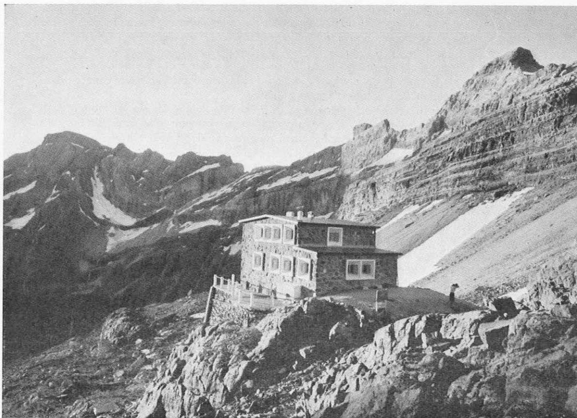
Koča CAF imenovana La Brèche de Roland