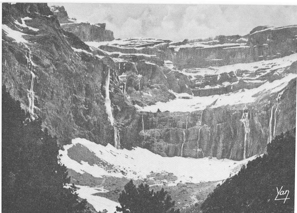
V zatrepu doline Gavnaric

kolesnega tovrnega živinčeta. In to doživetje, moram poudariti, je res množično. To ni tisto, čemur pri nas tako radi pravijo le doživetje za izbrance, ki bi radi imeli gore le zase itn. itn. Kako prav bi bilo, da bi tudi pri nas, pri tehnicaciji in približevanju naših gora množičnemu obisku, pomislili, da za turista včasih ravno malo neudobja pomeni privlačno doživetje. Kdor je kdaj pred gradnjo ceste v Vrata pripeljal tiste urice do Aljaževega doma po stezi in kdor se danes pripelje z avtom, ta bo vedel, kaj mislim. Gotovo ni treba pretiravati, gotovo se ni treba upirati sodobnemu razvoju, vendar je treba vedeti, da človek, tudi tisti najbolj nepodjetni človek iz pisarn, išče možnosti za majhne podvige, ki mu jih je konec koncev treba tudi organizirano nuditi. Tisti, ki so odgovorni za končno oblikovanje prometnih naprav v Logarski dolini in drugod, naj premislijo tudi o tem. V Logarski in drugih naših gorskih dolinah je še veliko takega, kar bi se dalo izoblikovati v doživljaj, ne pa preprosto položiti pred obiskovalca na krožniku sodobne tehnike. Tehnike, ki je je v življenju današnjega človeka tako in tako še preveč.