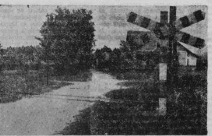
Križišče železnice in ceste Zg. Hajdina—Draženci, kjer je prišlo do nesreče 7. junija 1959

V nedeljo 7. junija t. l. je prišlo na križišču železnice proge Pragersko — Ptuj — Kotoriba in ceste Zg. Hajdina — Draženci pri Letonjevi hiši kak kilometer južno od železniške postaje Hajdina do težke prometne nesreče, ki je zahtevala žitljenje 54 letnega