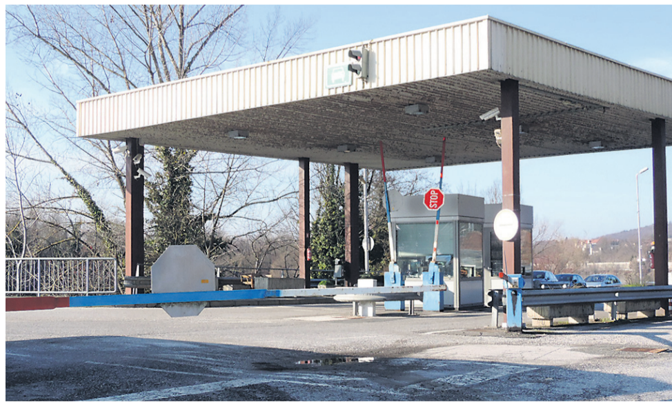
Mejni prehod bodo v celoti zgradili na novo, in sicer na način, da se bo prehajanje skozi prehod navezalo na novo vzhodno ormoško obvoznico in tako ne bo več potekalo po zdajšnji cesti preko nivojskega železniškega prehoda.