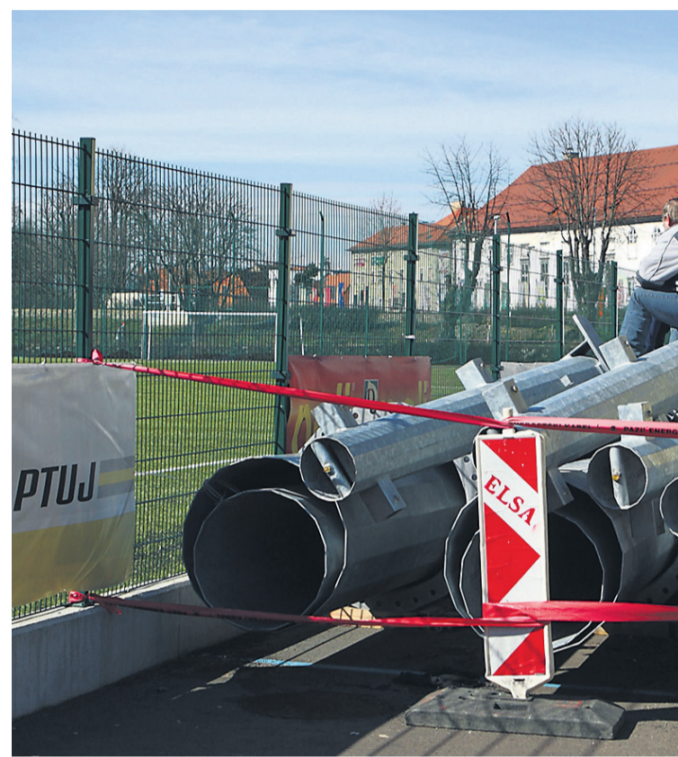
Na Ptuj so nekoč reflektorji že bili, a le na fleh ...

Ob tem dodaja, je bila tako kot danes tudi možnost sofinanciranja nakupa s strani Nogometne zveze Slovenije. Občina Lendava, kamor so potem prodali na Ptuj nikoli nameščene reflektorje,