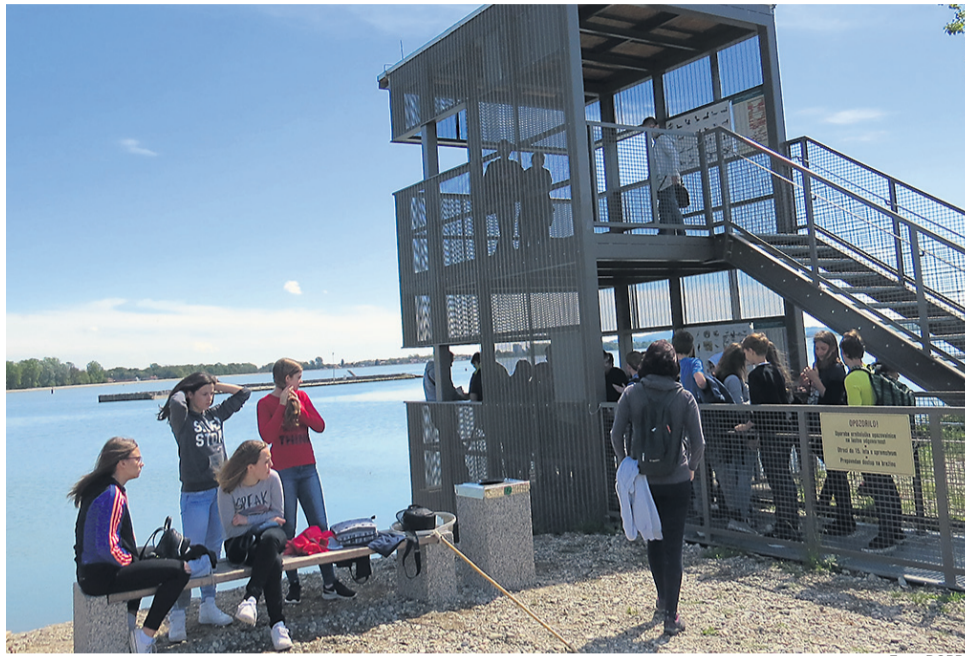
Ob Ptujskem jezeru so postavili ornitološko opazovalnico.

Dejala sta, da projekt LiveDrava predstavlja pomembno razvojno priložnost za celotno območje med Mariborom in Središčem ob Dravi, še posebej za ormoško občino: »V okviru projekta smo na območju bazenov za odpadne vode nekdanje Tovarne sladkorja Ormož (t. i. lagune) ponovno vzpostavili