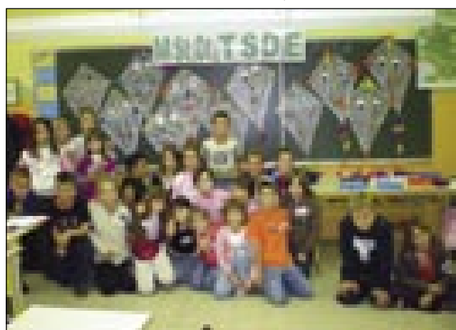
Učenci obeh šol in priložnostna razstava

Radi bi se zahvalili za ta dan vsem učiteljicam, ki delajo na mačkovski šoli, posebej pa učiteljici Aniti za vabilo.