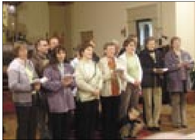
Gorenjesenički cerkveni zbor

in pokojne Slovence, ki tū živijo ali počivajo v Budimpešti daleč od rojstnega kraja. V predgi je od tauga guncō, ka si vsakši človek mora najti nin svoj daum, svojo družinsko hišo, mi smo go tū v taum velkom varaši najšli. Vej, ka je tau nam žmetno bilau, vej smo pa iz tisti mali vasnic, gde vsakši pozna vsakšoga, prišli sé, gde smo tijinci bili, nejmo vedli za drugoga. Pa kak je čüdiviten Baug, nam je pomago, ka smo najšli eden drugoga. Zdaj, ka že mamote dvej organizacije, nam je že baugše, smo več nej pogübleni, se leko srečujemo, nücamo materni gezik. Kak vidi, smo najšli hišo tō, gde so nas sprejeli, tau je cerkev. Pa vörje, ka gnauk notra staupimo v najveško hišo tō, v nebesa.