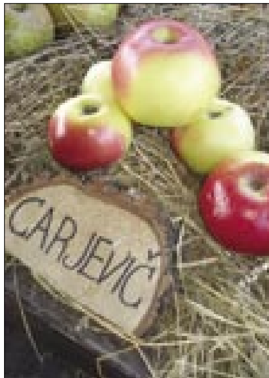
En tau razstave

bilau. Zdaj se začne malo spreminjati, zato ka vsigdar bole iščejo te stare sorte. Tau je pa zato, ka té nej