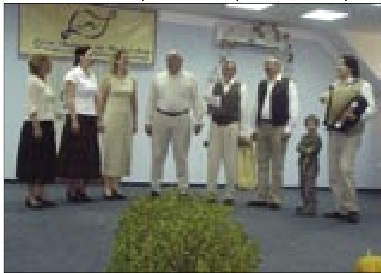
Člani ansambla Rožmarin na nastopu v Monostru