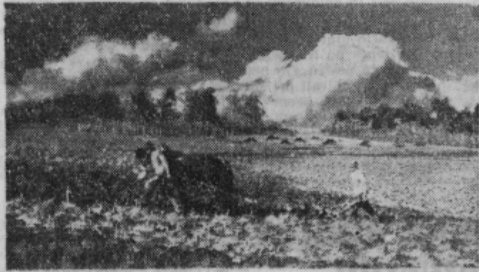
Za žetvijo bo kmalu nova skrb — oranje.