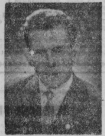
pridobil pravico tekmovanja na državnem prvenstvu. Leta 1962 je bil 16., letos pa je stopil na stopnico zmagovalca, Korpar je tudi motorni pilot, vendar nadvsem ljubi svoje jadralno letalo. Sam pravi, da je v jadralnih letalih najlepše. V teh letalih je mirno, neslišno ploveš na zračnih blazinah ter iščeš zračno strujo. Čutiš neko notranje zadovoljstvo, ko najdeš termični stolp, v katerem se lahko vzdiglaš tudi nad oblake.