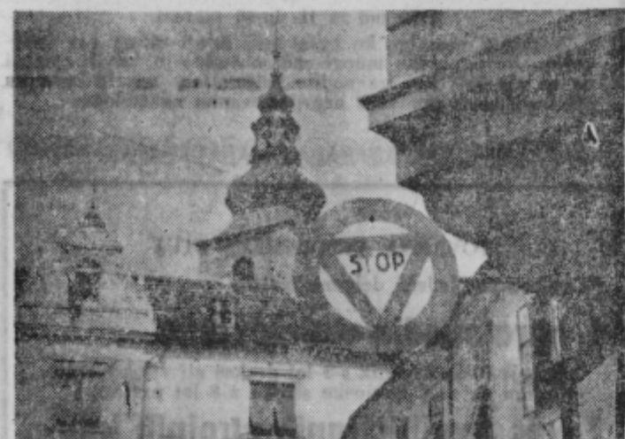
Stop — jasno govori znak na oglu Lackove ulice — če že ne zaradi prometa, pa vsaj da ne zamudite pogleda na stari ptujski zvonik. Zal nitj znak niti zvonik ne služita najbolje svojemu namenu. Znak avtomobilisti kaj radi spregledajo, naši miličniki pri tem zamije, zvonik pa je odpoval pokorščino in niti s pomočjo golobov noče več pomagati Ptujčanom, ki se ne zanesejo preveč na lastne ure.