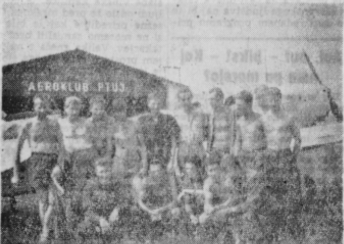
Udeleženci tečaja motornih pilotov za športno dovoljenje uprave civilnega letalstva.

V kolikor bo navedenega dne slabo vreme, velja isto za naslednji dan.