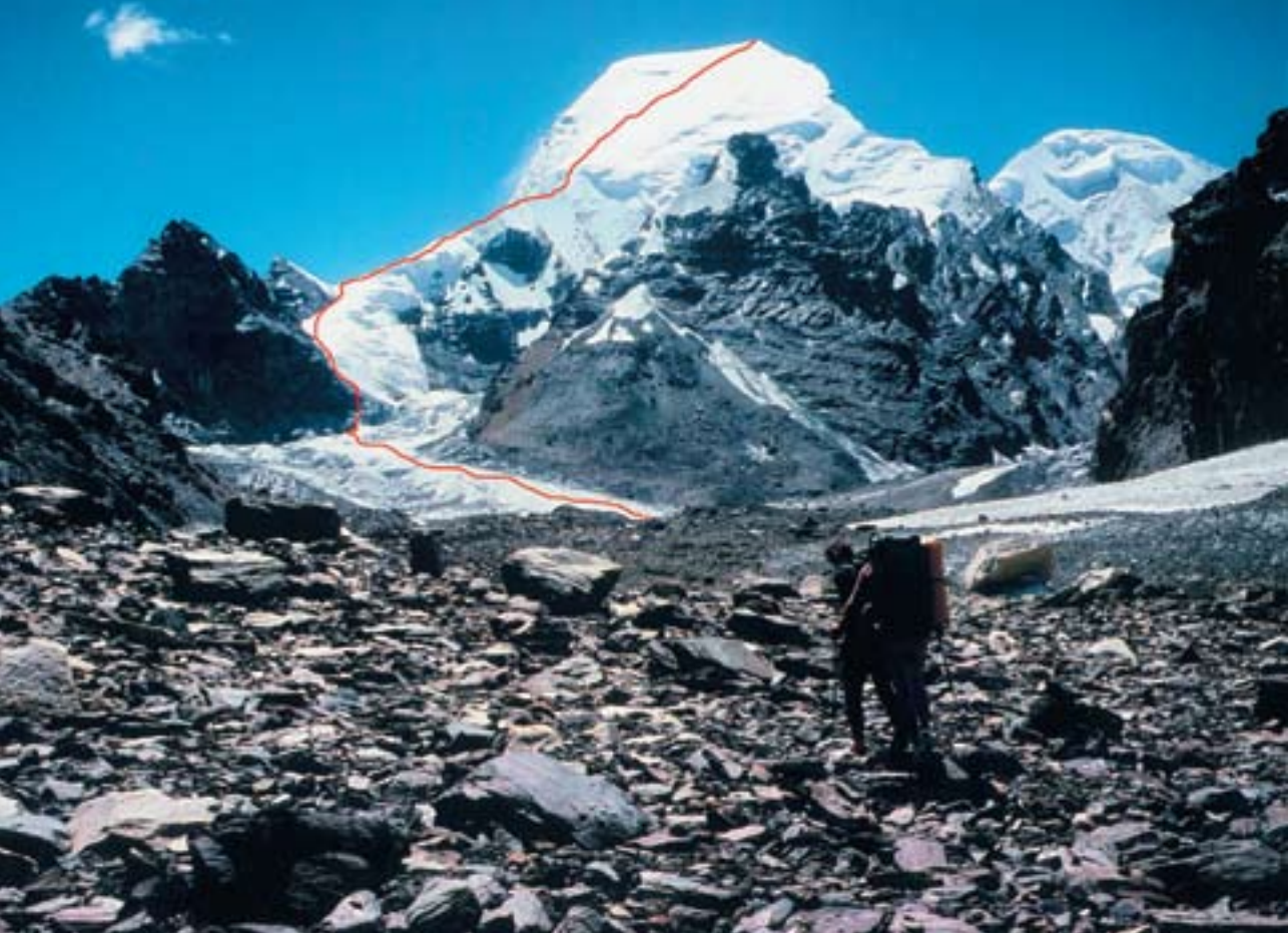
Satopanth: smer po severnem grebenu

enega najbolj svetih hindujskih krajev, saj tam izvira reka Ganges.