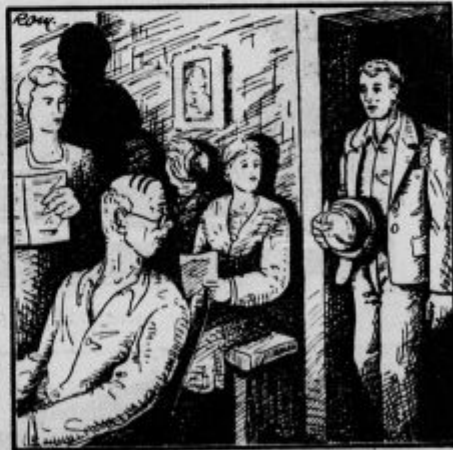
ko je na vratih zagledal slokega fanta

fanta, ki je prijazno pozdravil, se predstavitil in prosil, da bi smel sodelovati v zboru. Dekletom je zastal glas in oči so jim obvisеле na novem zastavnem pevcu. Fantje so se suvali s komolci in molče opazovali uglajeni nastop Gregorjevega hlapca. •Kakšen glas? je vprašal organist. Premaknil si je očala na nos in se obrnil k doščku. •Tenor! je dejal, pa še pripomnil, da je delj časa ni pel. (Nadaljevanje prihodnjic)