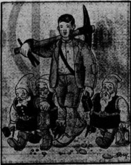
...ter so pogumno nastopili pot v večernem mraku.

Da so bolj videli, so hodili vstríc, Tinče v sredi, dva palčka na desni in eden na levi strani. Vendar dolgo niso mogli tako naprej, kajti rov je postajal ožji in ožji. Tudi so se začele viti ob