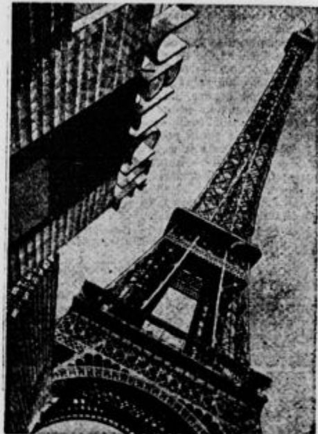
Eiffelov stolp, raz katerega je krasen razgled po Parizu in okolici

Vojna leta 1870 ni prizanesla Parizu. Nemci so oblegali mesto, ki se je 28. januarja 1871 vdalo sovražniku. Parižani so morali odšteti 200 milijonov zlatih frankov odškodnine.