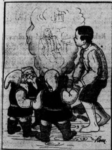
Tisti hip se je v sopari prikazala podoba princa Ljubomira.

»Primate se za roke in obudimo vsi eno željo, namreč, da vidimo princa in kraj kjer je.«