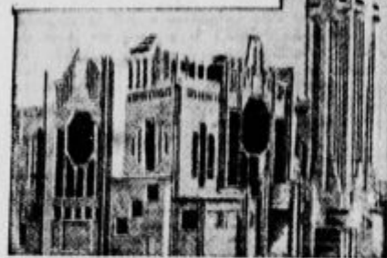
Znamenita pariška cerkev Notre Dame

Dočim je bil Pariz prvotno ratonišče kraljev proti plemstvu, je nastal izza 13. stoletja hrbenica meščanstva. Karel V. je zgradil utrdbo Bastiljo za zaščito proti Angležem in proti upornim Parižanom. Mailotini