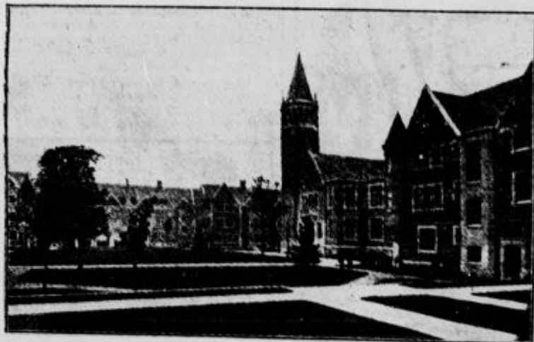
Pogled na vseučiliški del francoskega prestolnega mesta