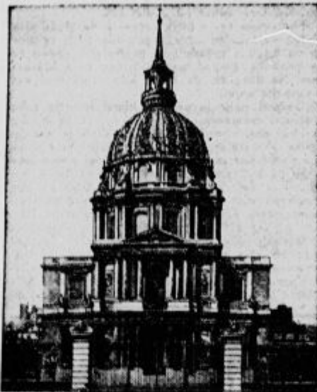
Invalidski dom v Parizu; tu počivajo zemski ostanki francoskega maršala Focha

V verskih bojih je imel Pariz veliko besedo. Bil je dolgo na strani starovercev in se je vdal šele leta 1593. V tistem času je dobil sledeča važna poslopja: Loure, Hotel de la Ville (magistrat), Pout Neuf in Tuilerije. Marija de Medici je položila temelje za Leksemburško palačo. Veliko pri-