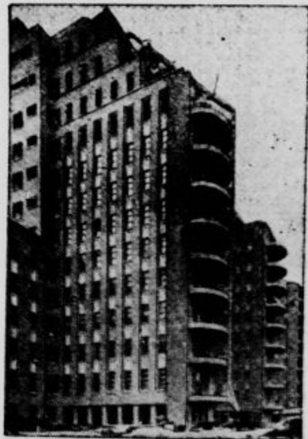
Bolnišnica v Beaujon à Clichy