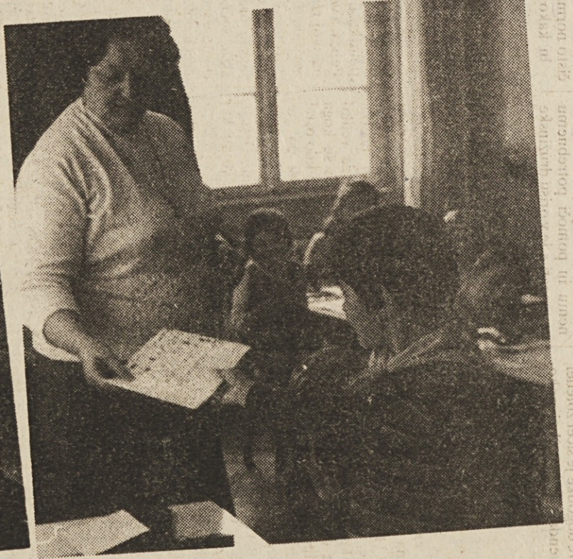
De-a curi vârca doborîie le arec sptiel vârî oror. Alen zborim în ne-