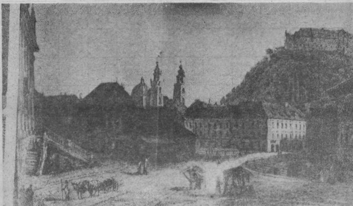
LJUBLJANA, KI JE NI VEČ

Informacije dobijo starši VVZ »Ana Zihelr«, osnovni šoli »Tone Čufar« in v krajevni skupnosti Kolodvor, Moša Pijadejeva 22.