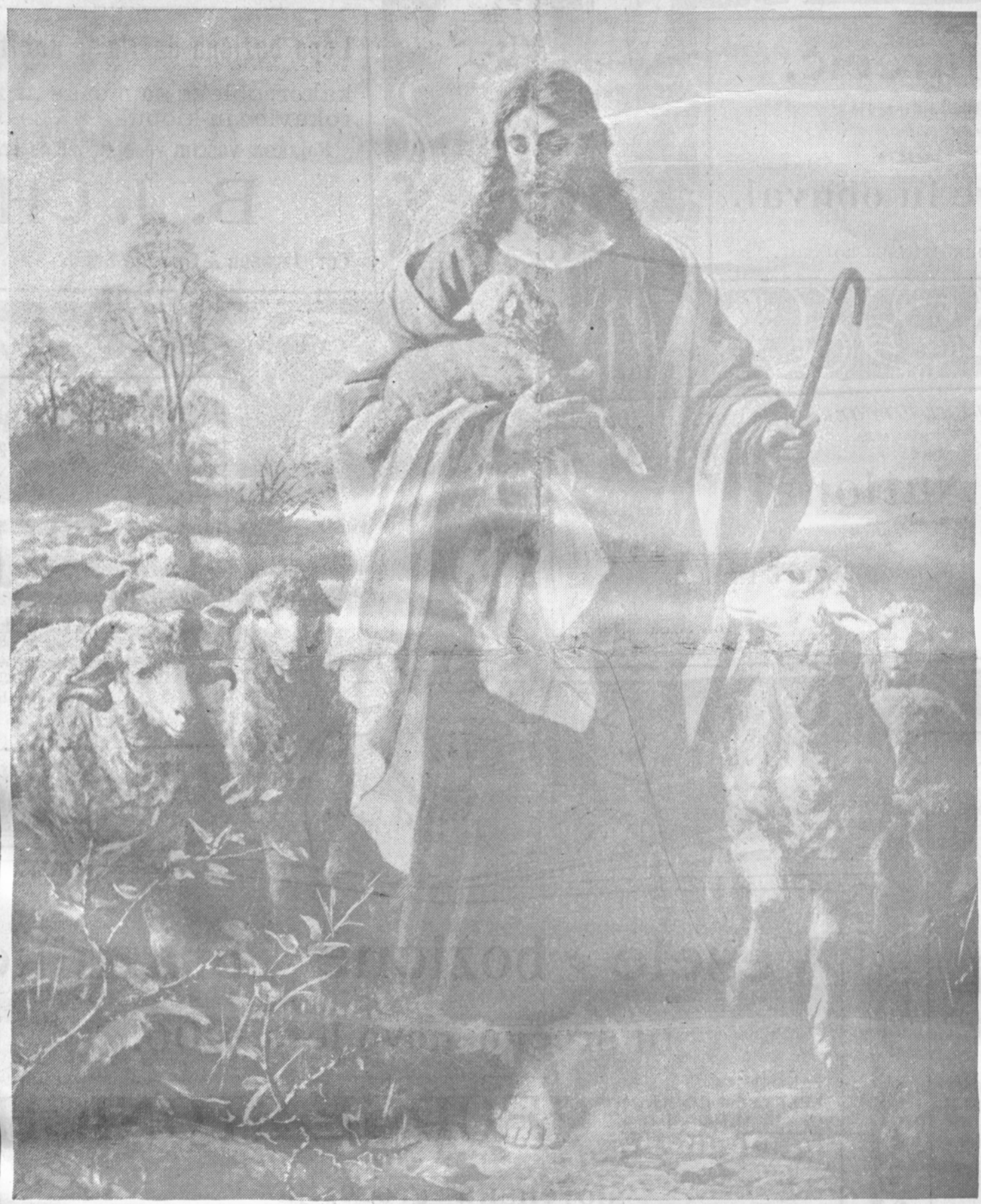
Jezus Dobri Pastir.