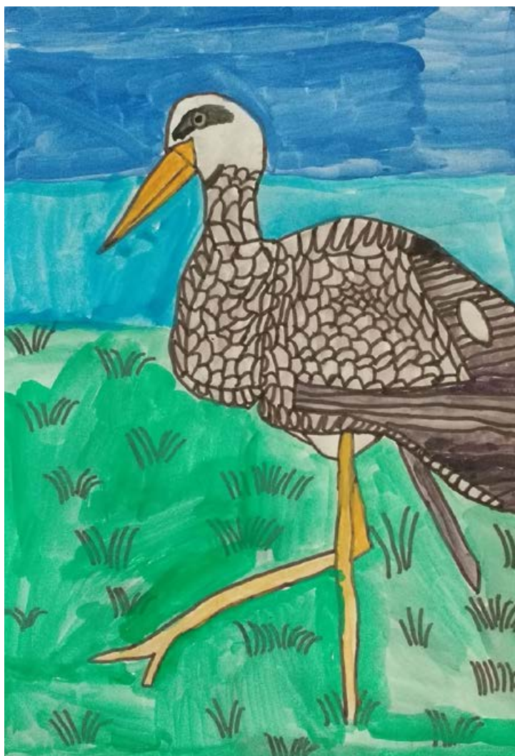
Tomaž Korez, 7. razred