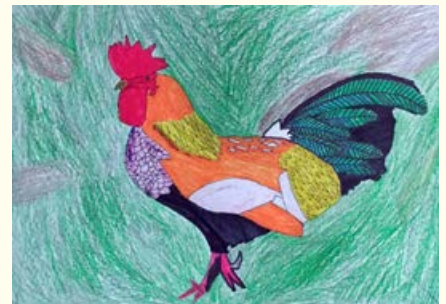
Alen Stres, 7. razred