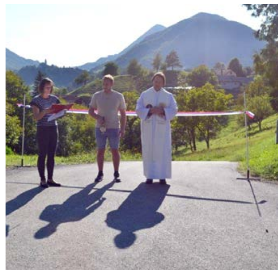
Slavnost na odcepu Vogrinc