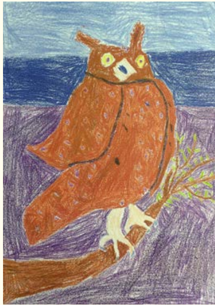
Miha Magdič, 6. razred