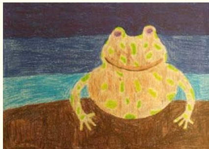
Neža Skledar, 6. razred