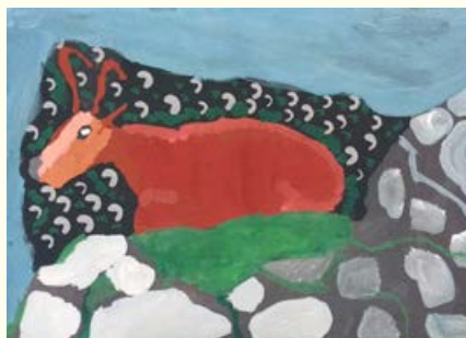
Žiga Bukvič, 7. razred