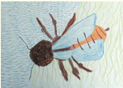
Julija Železnik, 6. razred