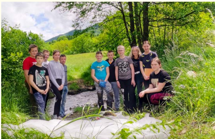
Mladi ekologi – skupina OŠ Žetale, Odlaganje gradbenih odpadkov

Žal smo zaznali tudi neodgovorno ravnanje domačinov, ki v strugo Rogatni-