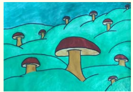
Žiga Skledar, 8. razred