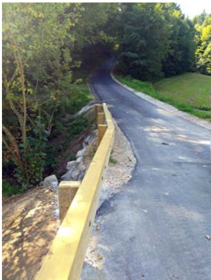
Lesena varnostna ograja Krhiče-Lešje-Podlog