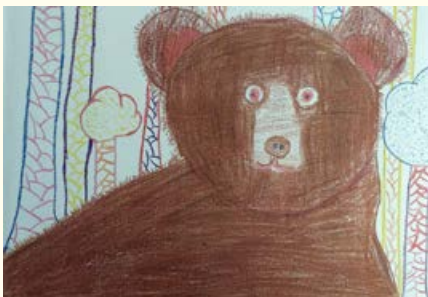
Melanija Širec, 6. razred