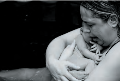
Rojstvo: Prvo srečanje z zunanjim svetom, prvi pogled, prva dobrodošlica.

postale modre ženske, sage femme , kot je neposredno ohranjeno v francoskem poimenovanju babie –, da bi zadostile temeljnemu pogoju babičenja?