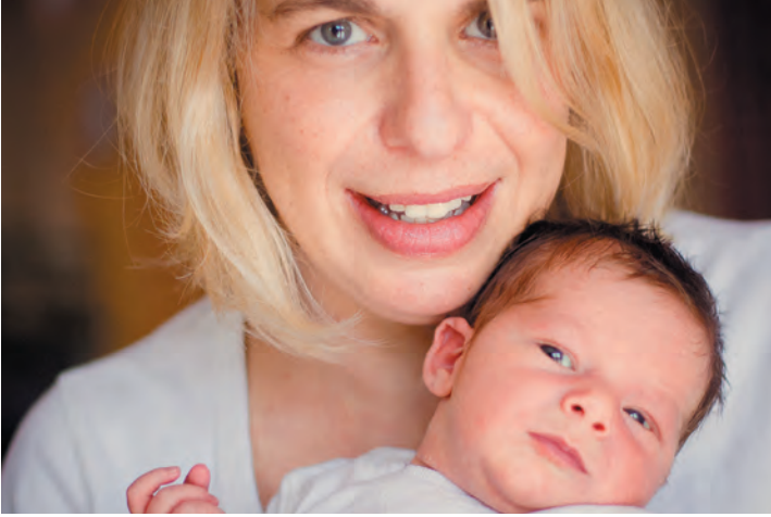
Andro v maminem naročju.