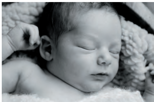
Takoj po rojstvu: Del celote: na prsih, v objemu staršev, v sebi.

govorijo o bogastvu vednosti, na primer o prepoznavanju napredovanja poroda iz načinov dihanja in oglašanja ženske ali rabi vo-ha za ugotavljanje razpoka plodovih ovojev. Nikakor ne bi smeli podcenjevati simbolnih ukrepov, ki so jih babice predlagale v do-