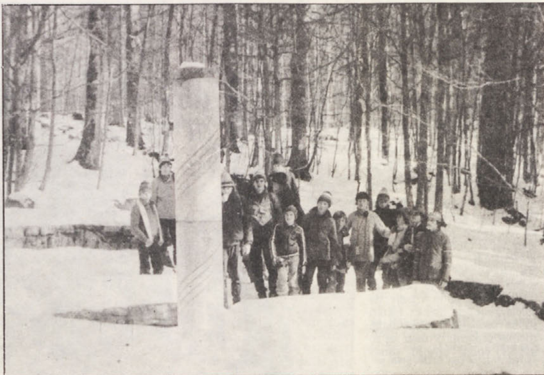
Udeleženci tabora pred spomenikom pri požgani bolnici Pugled

Vodstvo tabora meni, da sta tako tabor kot tečaj zelo uspela, saj so bili vsi zadovoljni, kar so potrdili tudi v anketi, ki smo jo izvedli ob koncu vsake izmene. K dobremu počutju tabornikov pa je veliko pripomogla tudi odlično opremljena kočica s čudovito okolico.