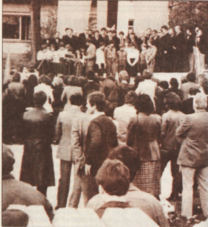
Motiv s proslave