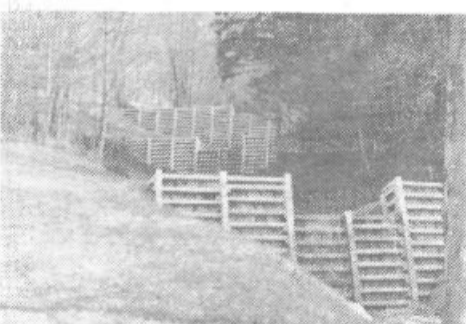
Lani je PUH obnovil pregrade v Petričevem grabnu. S tem je pripomogel k umiritvi tega hudournika ter zaščiti travnikov, polj in zgradb pred razdiralno močjo tega vodotoka

V beležki imam zapisane naslove sogovornikov. A, ker menim, da so pomembnejša dejanja, ne bom navedel njihovih imen. Samodejno je pogovor povsod nanesel na akcije za zaščito Polhovega Gradca in nizvodno ležečih naselij pred katastrofalnimi vodami. Prav gotovo vas zanima, kaj o tem menijo domačini.