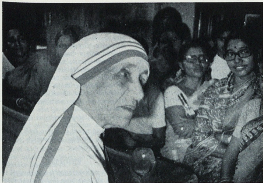
O. Cukale: „Naše učiteljstvo je šlo k materi Tereziji, da se ji zahvali, ker je tako uspešno posredovala pri vladi za odobrenje naše srednje šole.“