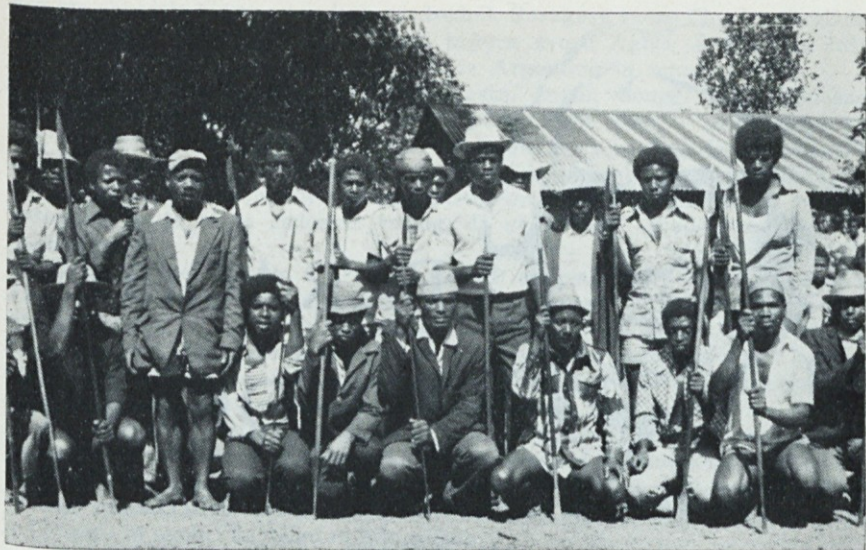
Možje iz Ankarane na Madagaskarju; s takšnimi palicami oboroženi so skrbeli za red ob posvečenju nove cerkve.

da negujem otroke, itd. in oni v Tabrizu so sestavili dopis na šefa policije, in dali so mi spet dovoljenje za bivanje in delovanje. Tako sem kar na trdnem do 25 junija 1981. Druge naše sestre so pa vse bolničarke, zato ni problemov.