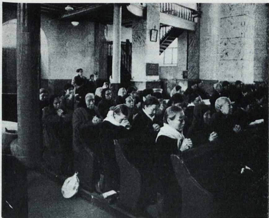
Kitajski verniki, zbrani pri sveti maši v edini odprti pekinški katoliški cerkvi.

Kadafi. So pa kraji, kjer je sožitje med muslimani in kristjani lepo. Tak primer je Senegalija. Tu pa ni vidna samo strpnost, ampak sodelovanje na kulturnem in karitativnem področju. Ko se Cerkev toliko trudi, da bi se približala tudi nekrščanskim verstvom in je organizirala že nekaj lepih srečanj, je vendarle danes v muslimanskem bloku nekako razpoloženje „svete vojske“, kjer pa se ta vojska spreminja v požar, ki utegne zajeti več kot samo islamski svet.