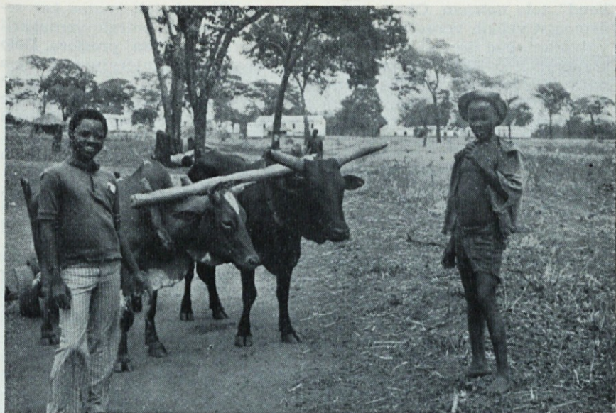
Bogoslovec in fantič s kravama; spodaj cerkev na središču misijona Belih očetov Chassa. Vidne so ptice „egret“.