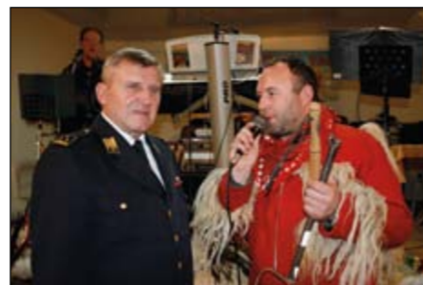
V korantijah so hajdinski koranti že po tradiciji obiskali kar nekaj gasilskih občinskih zborov in gostiteljem v spomin predali mini ježevke. Utrinek je iz Slovenje vasi.