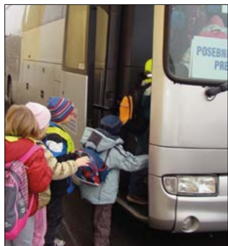
Tudi na avtobus vstopamo varno.

Urška, Monika, Kaja, Nuša in Klara iz 5.a razreda