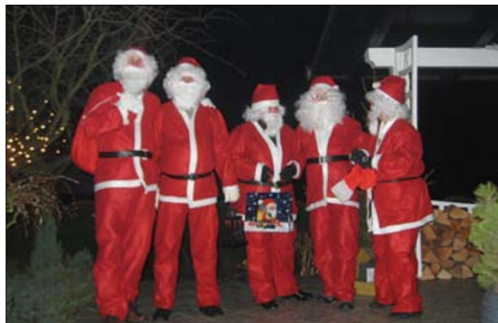
Na božični večer je bilo moč v Gerečji vasi srečati prave Božičke, ki so po hišah poleg bombonov delili mir, veselje in zdravje v prihajajočem letu.