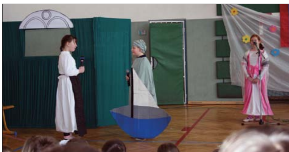
Dramatizacija Lepe Vide je v 4. b razredu nastajala ob mentorstvu razredničarke Marjete Horvat.