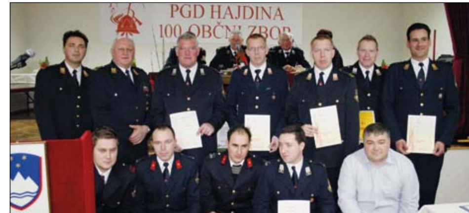
Zaslužnim hajdinskim gasilcem so podelili napredovanja, priznanja in zahvale, ob jubileju pa so prejeli mnogo čestitk in dobrih želja.

desetino, kar je bil velik ponos za društvo, ob obletnici pa so kupili tudi rabljen avtobus in ga opremili z avtociстерno za prevoz gasilcev in opreme. V letih kasneje so gasilsko tehniko večkrat dopolnili in zamenjali, ob 60-letnici društva so razvili novi društveni prapor, v letu 1973 pa je bil za hajdinske gasilce najpomembnejši dogodek - ustanovitev gasilskega centra Hajdina, v katerega so vključila gasilska društva: Hajdina, Turnišče, Slovenja vas, Gerečja vas in enota Kungota. V tistem obdobju pa so hajdinski gasilci sklenili še prijateljstvo z gasilci iz Mihalovca na Dolenjskem.