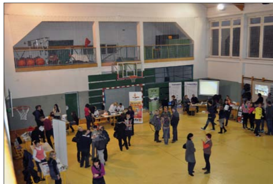
Naši učenci in njihovi starši so se lahko poučili, kaj jim nudi praktičnega posamezna šola, kamor bi po zaključku devetletke tudi želeli.