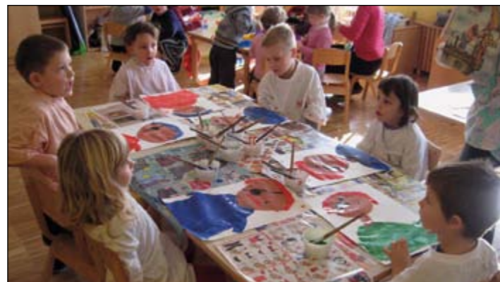
V rumeni igralnici (4-5 let) že težko pričakujemo pustni čas, zato smo se pridno lotili ustvarjanja in naslikali gusarje.