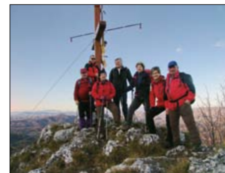
Nekateri so uspešno premagali tudi naporni zimski vzpon na Peco.

6. januar se je 26 pohodnikov odpravilo preko meje, v sosednjo Hrvaško,