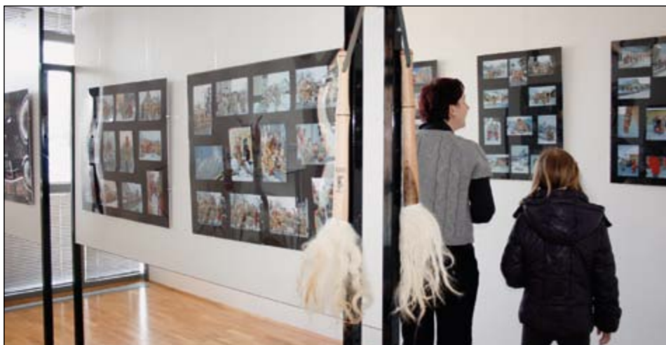
Fotograf Milan Strnad je v družbi hajdinskih korantov v minulih letih naredil ogromno fotografij in nekaj najboljših, prepoznavnih je v času pusta postavil na ogled v razstavišču PSC Hajdina.

Le dan po svečnici, ko so koranti in drugi pustni liki začeli s svojim poslanstvom – odganjanjem zime in vsega slabega iz naših krajev, so na Hajdini, v razstavišču PSC odprli zanimivo razstavo fotografij z naslovom Koranti Hajdina med nastopi.