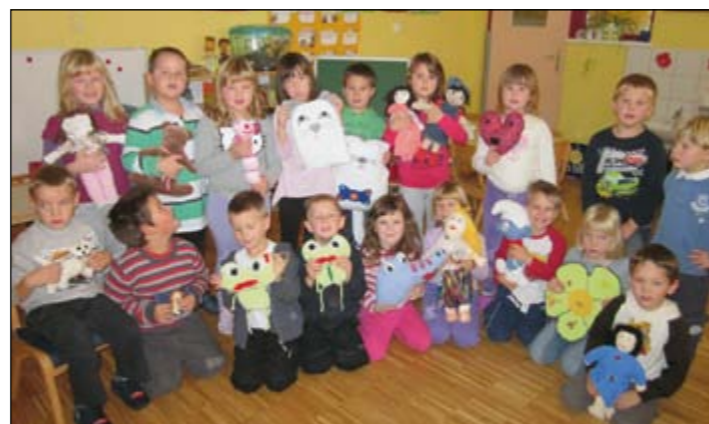
Otroci rdeče igralnice z objemčki, ki so jih naredili s svojimi starši v okviru akcije »obdarovanje«.