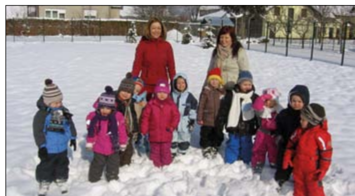
Otroci iz modre igralnice so končno dočakali sneg in sonce hkrati. Sedaj pa še samo snežaka naredijo, pa bo!