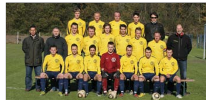
Članska ekipa NK Hajdina