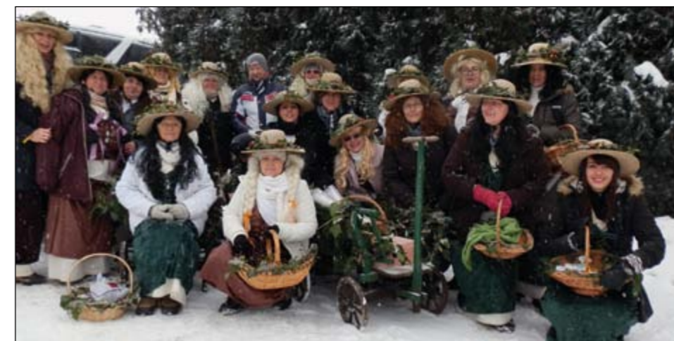
Sobotnega Medcelinskega Etnofesta na Ptuju, kjer se je na otvoritveni pustni povorki v sklopu EPK na Ptuju predstavilo skupaj 60 tujih in domačih etnografskih skupin, se je udeležilo 18 članic Društva gospodinj. Bile so zeliščarice s svojo zgodbo, oblečene v nova oblačila, z okrašenimi klobuki, košaricami polnimi receptov domačih čajev, na lesenem vozičku so vozile kuhano vino in čaj z domačimi likerji. Vse to so ponujale prepraženim gledalcem, njim pa je bilo zelo toplo... vsaj pri duši, če so koga malo ogrele.