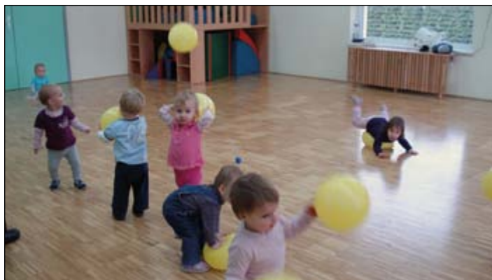
Otroci oranžne igralnice v telovadnici med igro z baloni.

Viktorija Vrabl, pomočnica ravnateljice za vrtec