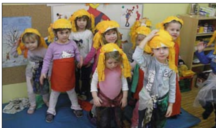
Pike Nogavičke iz zelene igralnice.