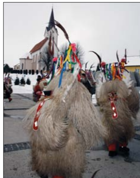
Navkljub slabemu vremenu in snegu so si koranti upali na pot. V korantijah so prehodili kar nekaj kilometrov in tako znova dokazali, da so v dobri pustni kondiciji.