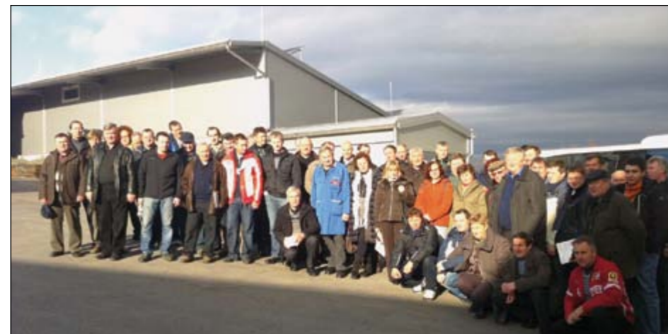
Utrinek iz zimske ekskurzije Posestnika v podjetju Vitli Krpan v Šmarju pri Jelšah.

Še pred koncem minulega leta so v okviru druge strokovne ekskurzije člani SK Posestnik obiskali podjetje Vitli Krpan v Šmarju pri Jelšah. Mnogi člani krožka med svojo mehanizacijo posedujejo tudi to vrsto na kmetiji nepogrešljivih priključkov, zato so za obisk tovarne pokazali izjemen interes, avtobus pa resnično zapolnili do zadnjega sedeža. In izplačalo se je. Obiskali so prvovrstno zgodbo o uspehu.