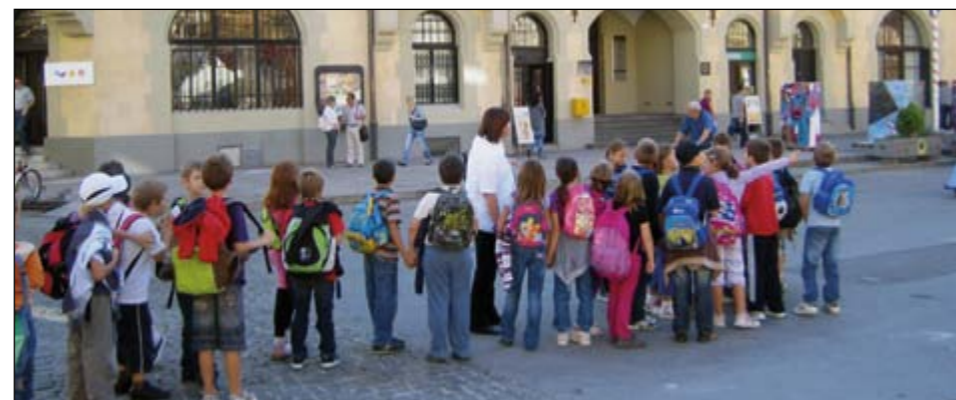
Pomen varnosti otrok je osnova za vsak izlet po mestu, kot tudi na poti v šolo in drugje.

Letošnje leto pa smo se odločili, da se bomo vključili v projekt Dobimo se na postaji, kjer bomo skrbeli za čim manjše onesnaževanje okolja, hkrati pa bomo tudi bolj zdravi. Ta projekt