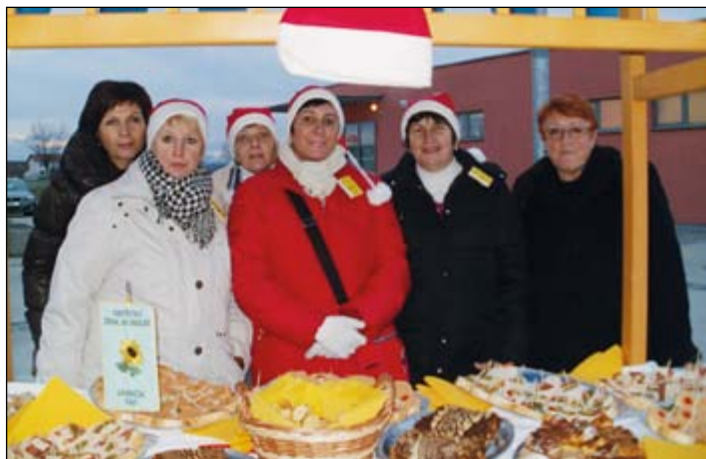
Božičkove stojnice na občinskem trgu, 21. decembra, kjer so bile zraven tudi članice DŽD Gerečja vas.