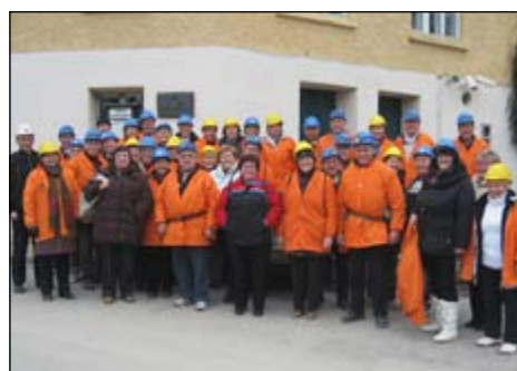
Fotka: Za tiste, ki radi odhajajo na izlete DU, spomin na lanskoletno ekskurzijo v Rudnik svinca in cinka v Mežici.

V Društvu upokojencev Hajdina potekajo priprave na jubilejni, 60. zbor članov, ki bo v soboto, 24. marca v Domu vaščanov v Dražencih.