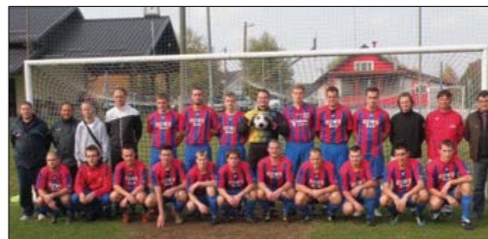
Članska ekipa NK Slovenja vas