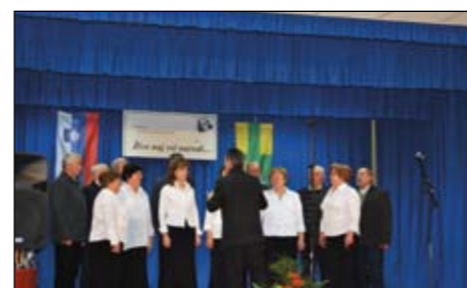
MePZ društva žena in deklet Gerečja vas.