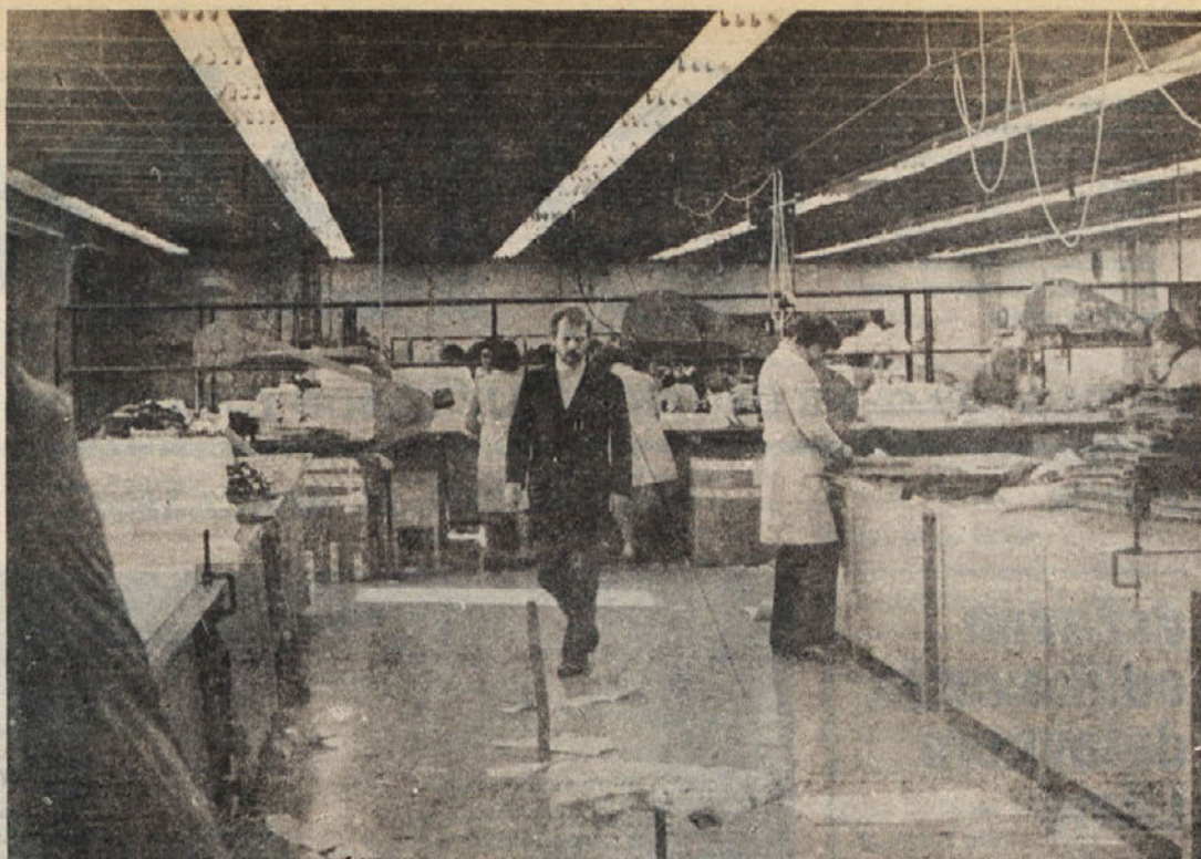
V krojilnici tozda Libna

Strinjam se in podpiram ideje, da se čim bolj stabilizacijsko obnašamo pri sleherni vrsti stroška, pa naj bo v materialu ali času, in da v tej zvezi opozarjamo drug drugega, čeprav pa ob tem opažam, da pa prepogosto pozabljamo na tiste stroške, ki predstavljajo velike zneske. Že nekaj let