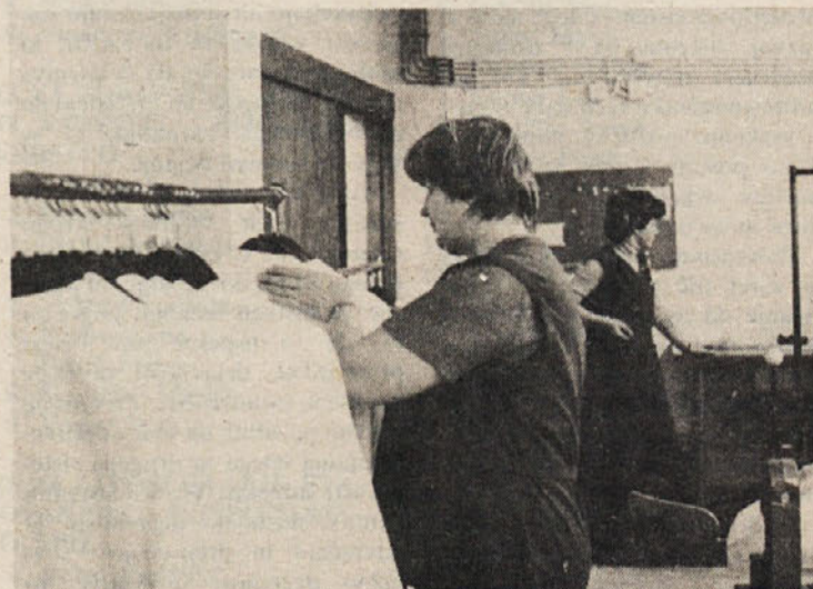
V proizvodnji je vedno vroče. Posnetek je iz Zale.